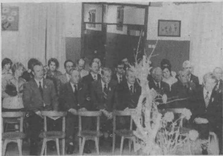
Slavnostna seja sveta KS Zelena jama, na kateri so proglasili 20. maj za krajevni praznik

Proslava se je pričela s slavnostno sejo, na kateri so 20. maja svečano proglasili za krajevni praznik. Pred spomenikom pad-