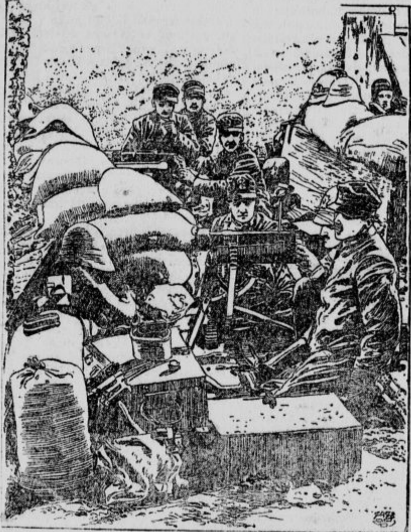
Italijanski oddelek s strojnimi puškami v okopih pred Tripoljem.

Kakor se poroča, je angleška vlada izjavila po svojem poslaniku v Rimu, da je nevoljna, ker so Lahji zasedli Torbruk, češ, da so oškodovane angleške koristi v Sredozemskem morju.