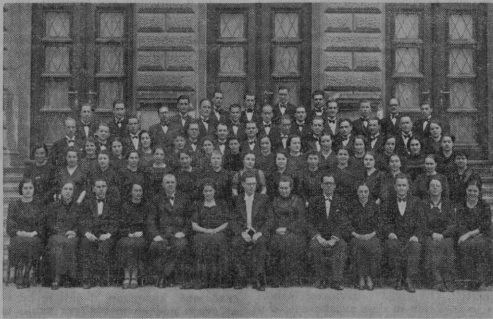
Koncertna turneja od 8. do 17. maja.