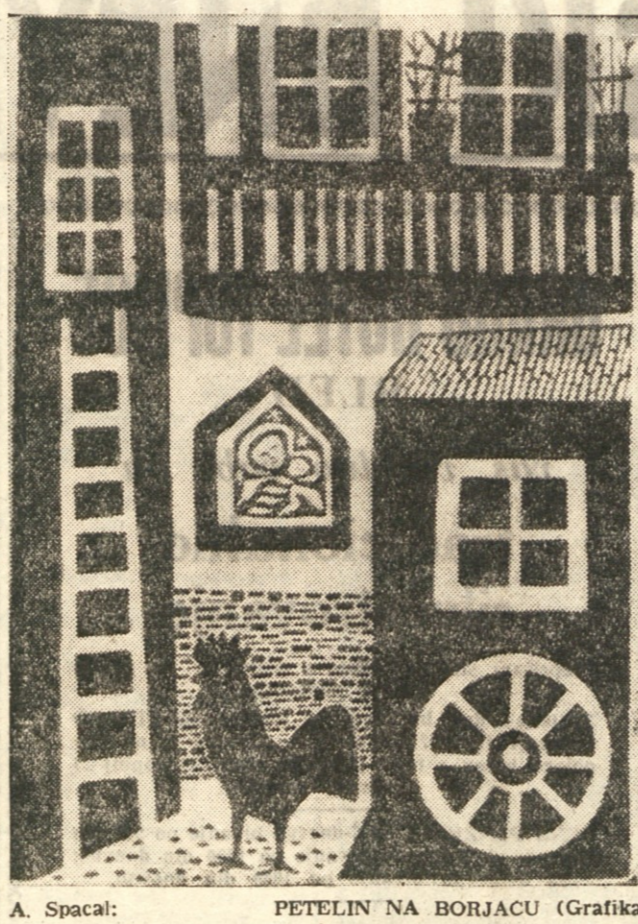
A. Spacal: PETELIN NA BORJACU (Grafika)