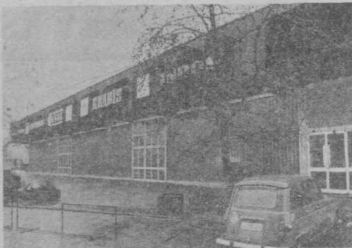
Športna dvorana Kodeljevo