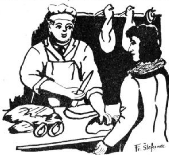
Mesar: Sedaj vas pa dolgo ni bilo k nam? Stranka: Veste jaz mesa bolj malo pojem, mož pa se ga je preobjedel na občnih zborih!

Po končani skupščini je bila za navzoče prirejena zakuska, kot skromna oddolžitev za njihovo delo.