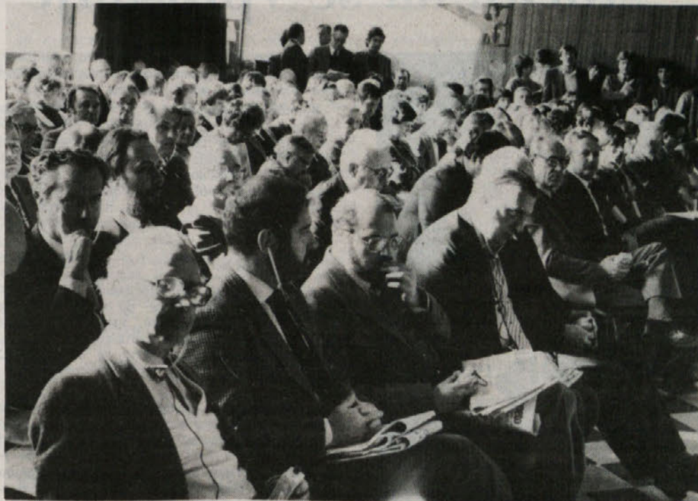
Mala dvorana Kulturnega doma med nedeljskim občnim zborom SKGZ

Uvodnemu delu občnega zbora so sledili poročili predsednika in tajnika in pozdravi gostov, nakar je predsednik SKGZ Race podelil priznanja (odličja in plakete boja in dela) tistim, ki so s svojim delom prispevali k uveljavitvi slovenske narodnostne skupnosti. V popoldanskih urah se je razvila živahna razprava. O vsem tem osežneje poročamo na tej in naslednjih treh straneh.