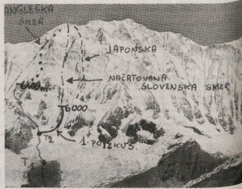
Pogled na Anapurno z baznega tabora