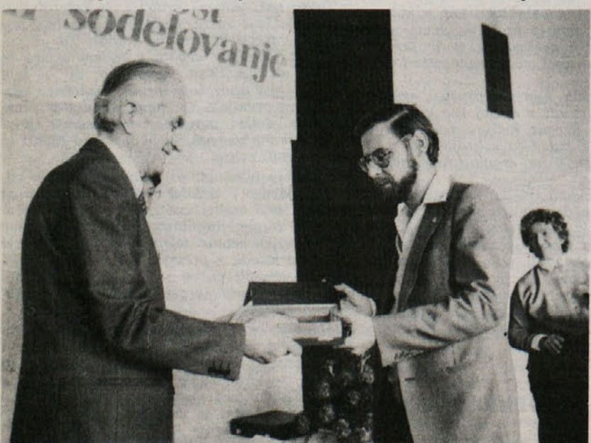
Plaketo boja in dela SKGZ je prejel tudi Rod modrega vala, ki letos praznuje 30-letnico delovanja

Ob koncu pa je Race apeliral na še tesnejše sodelovanje med vsemi osnovnimi organizacijami ter med članicami in vodstvom naše krovne organizacije.