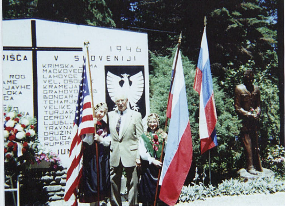
Orlov vrh - Cleveland