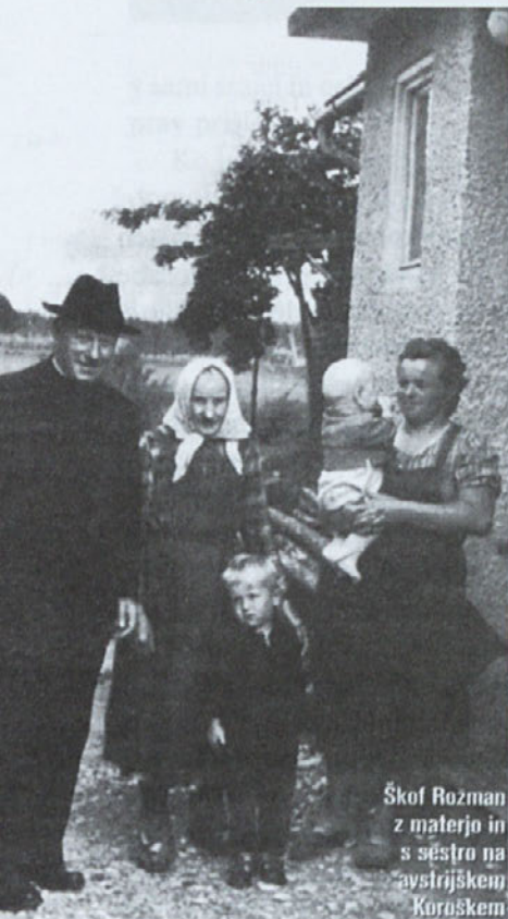
Škof Rožman z materjo in s sestro na avstrijskem Koroškem

Nekoč, morda ni daleč dan, ko se bo tudi ta led otajal.