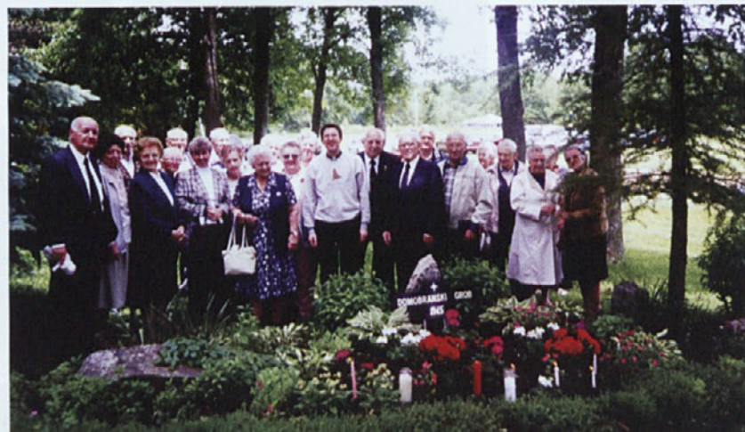
Park Triglav - Milwaukee