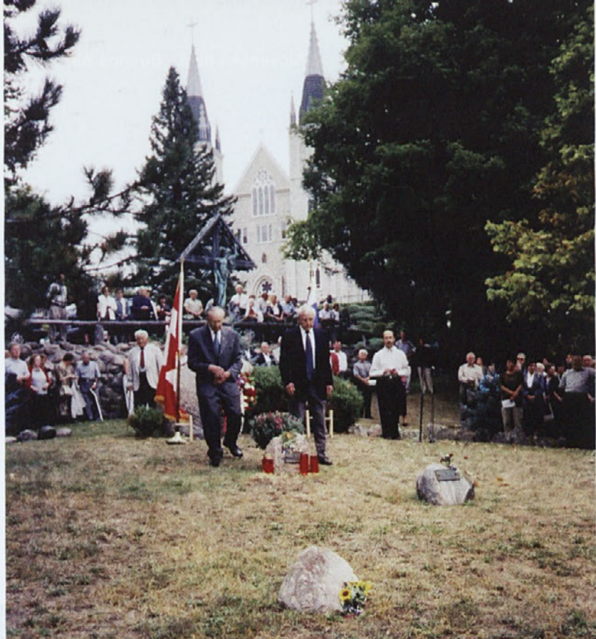
Midland - Kanada