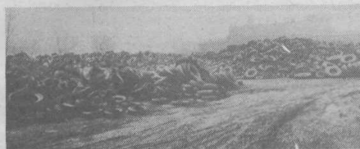
Nerabne gume na dvorišču