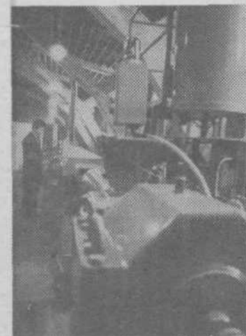
Nova UHF linija (vulkanizacija gume z visokofrekvenčnim poljem)

Predračunska vrednost za predvidene naložbe v vseh treh tozidih znaša 122.300.000 dinarjev. S tem denarjem naj bi posodobili tehnološki postopek, razširili proizvodnjo in zgradili nove upravne prostore. Seveda bo ta načrt težko uresničiti, saj v delovni organizaciji ne morejo zbrati niti obveznega dela denarja za naložbo, kaj šele, da bi gradili brez posojil. Lani jim po poravnavi vseh obveznosti ni ostalo niti dinarja za razširjeno reprodukcijo. Največja težava pri uresničevanju razvojnega načrta bo torej pomanjkanje denarja. Neustrezen pa je tudi sedanjí sestav delavcev glede na izobrazbo. Potrebni bi namreč le 11 nekvalificiranih delavcev, imajo pa jih kar 108, medtem ko bi jih z visoko izobrazbo morali imeti 14, zaposlenih pa jih je le 6.