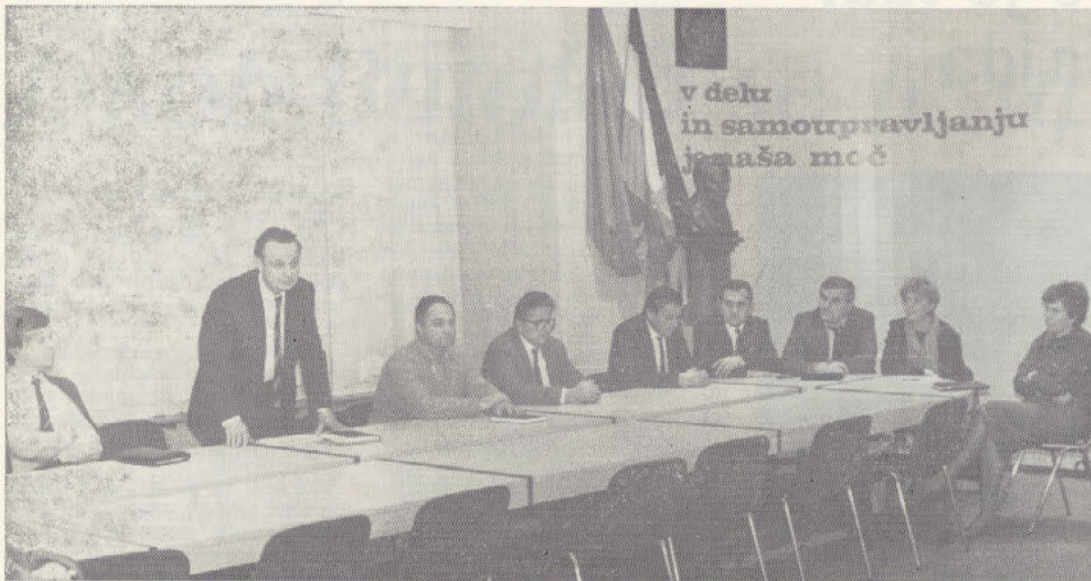
Sindikalni delavci iz Varaždina med obiskom v Perutnini

Slušatelji občinske sindikalne šole so v svoj študijski program vključili tudi obisk Perutnine. V našem poslovnem centru so se zbrali v soboto 7. februarja. Seznanili so se z organiziranostjo, delovnim procesom in problematiko razvoja naše delovne organizacije. Programski del pa je zajemal obravnavo priprave zaključnega računa in način vodenja razprav o le-tem.