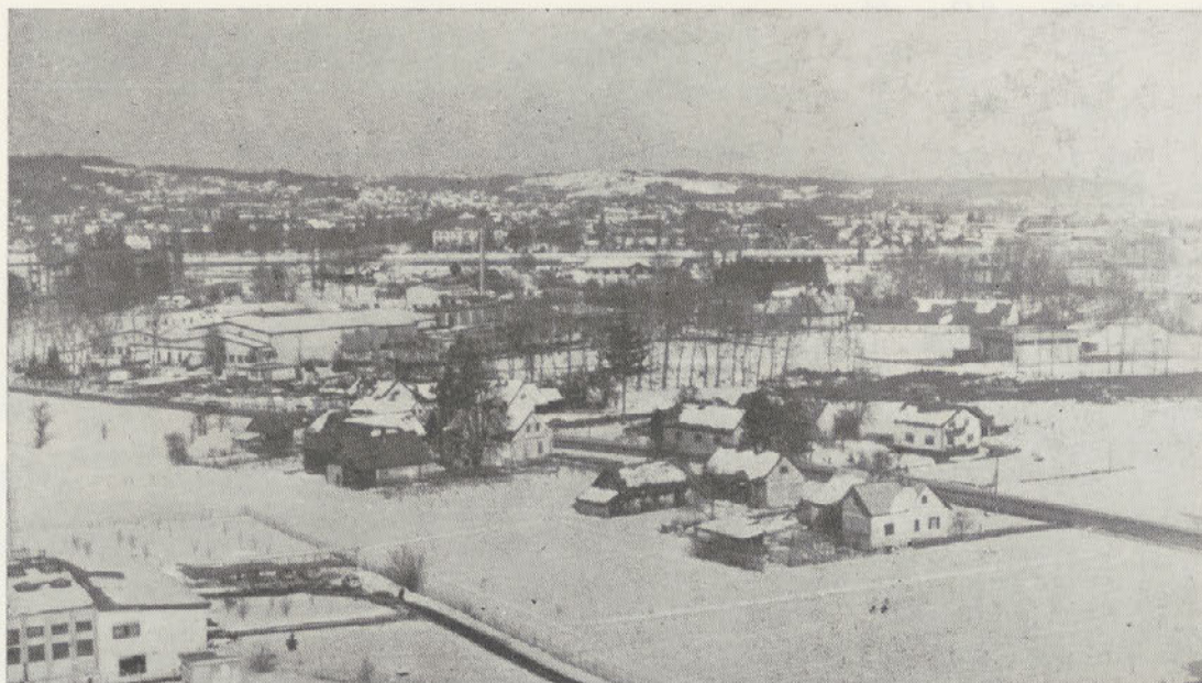
Pogled na perutninsko klavnico, kakršen se nam je nudil doslej. Sedaj je že precej drugačen. Druga faza gradnje (hladilnice in ekspedit) je že v teku. Na posnetku pa vidimo nadelavo dovodne poti in parkirišča.