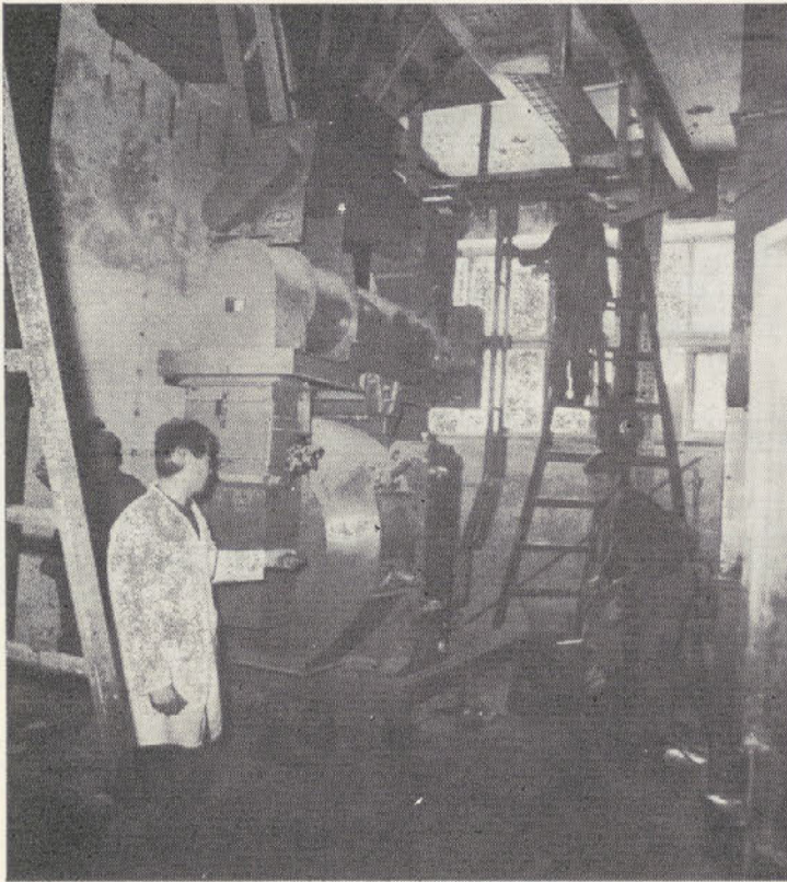
Montaža nove briketirke