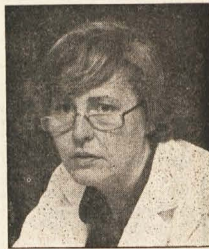
Državna sekretarka Johanna Dohnal (lova mesta žensk).

Morda pa je burka, ki jo igra Haider na koroškem političnem odru, v resnici le odskočna deska, da bi se pognal na dunajsko politično prizorišče?