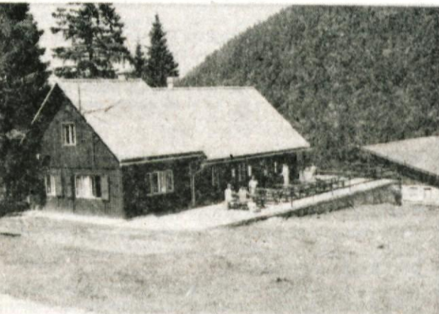
Litostrojsko kočico na Soriški planini so vzeli v najem zasebniki in bo vse leto odprta...

Največja težava je v tem, da imamo prostora dovolj tudi za večje, organizirane skupine, nimamo pa telefona. Že pred mnogo leti je tu sicer bil telefon, odkar pa je v kabel treščila strela, je od telefona ostala le številka v telefonskem imeniku! Vztrajno jo v imeniku vodijo, v resnici pa že dvajset let sploh ne obstaja. Zato informacije posredujemo vsak torek in petek od 8. do 10. ure na telefonski številki 622-130.