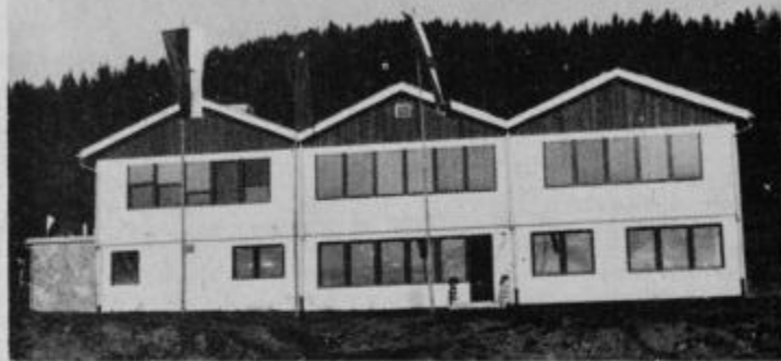
Nova osnovna šola na Kebelju.

skrajšana, nudila pa jim bo vse potrebno, da se po naporni poti znajdejo v svetlih, varnih in bolj opremljenih razredih, ki jim bodo s kabinetnim poukom nudili tudi širša obzorja znanja. Razen sodobnih učilnic so v novi šoli pridobili sanitarije, kopalnice, knjižnico odprtega tipa, kuhinjo z jedilnico, telovadišče in več drugih namenskih prostorov.