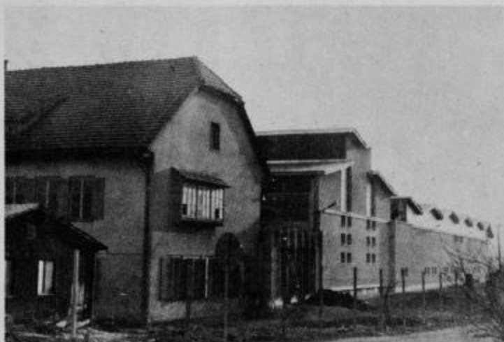
Nova proizvodna dvorana bistriske Steklarne