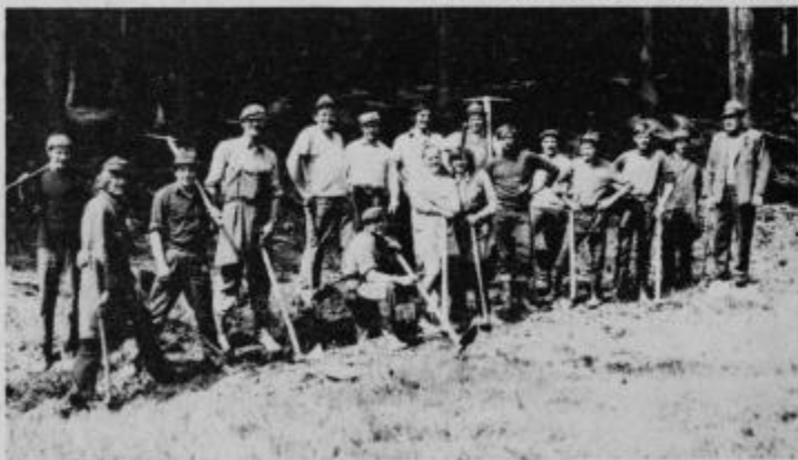
Njihove lopate in krampi so odmevali po kamniti in močvirnih pohorskih terenih.

Skupno so za gradnjo vodovoda Prihova opravili 58.065 udarniških ur. Če bi opravljene prostovoljne ure ovrednotili, bi prihranili 1.161.300 dinarjev, kar je več kot polovico celotne vrednosti, ki je znašala 2.794.300 dinarjev. Celotni