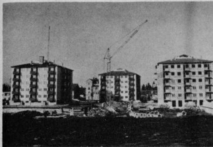
Solidarnostni stolpiči v Gregorčičevem drevoredu

zapisu. Pogovarjala sem se s tovarišem direktorjem.