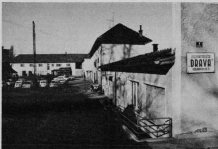
Upravno poslojje GP „Drava“ Ptuj v Osojnikovi ulici

vseh del je presežen za 41%, medtem ko je poraslo število učinkovitih ur in znaša 105. Ze iz teh globalnih podatkov je razviden porast produktivnosti. To je tudi dokaz, da je delovni kolektiv marljivo delal. „Pomagalo“ nam je tudi ugodno vreme vse do jeseni, ko je deževje onemogočalo izvajanje