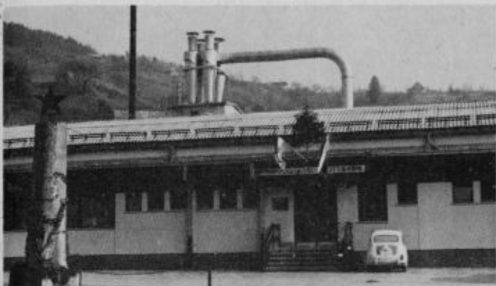
Nova proizvodna dvorana LIP Oplotnica. V ospredju spomenik ob 25-letnici lesne industrije.

postavil velik spomenik prihodnjim rodovom, saj so od 8. aprila 1974, ko so za vodovod zasadili prvo lopato pa do otvoritve uspeli prekopati 35.891 metra, ob tem pa so zgradili dva velika vodovodna rezervoarja in tri zajetja vode pod Pohorjem.