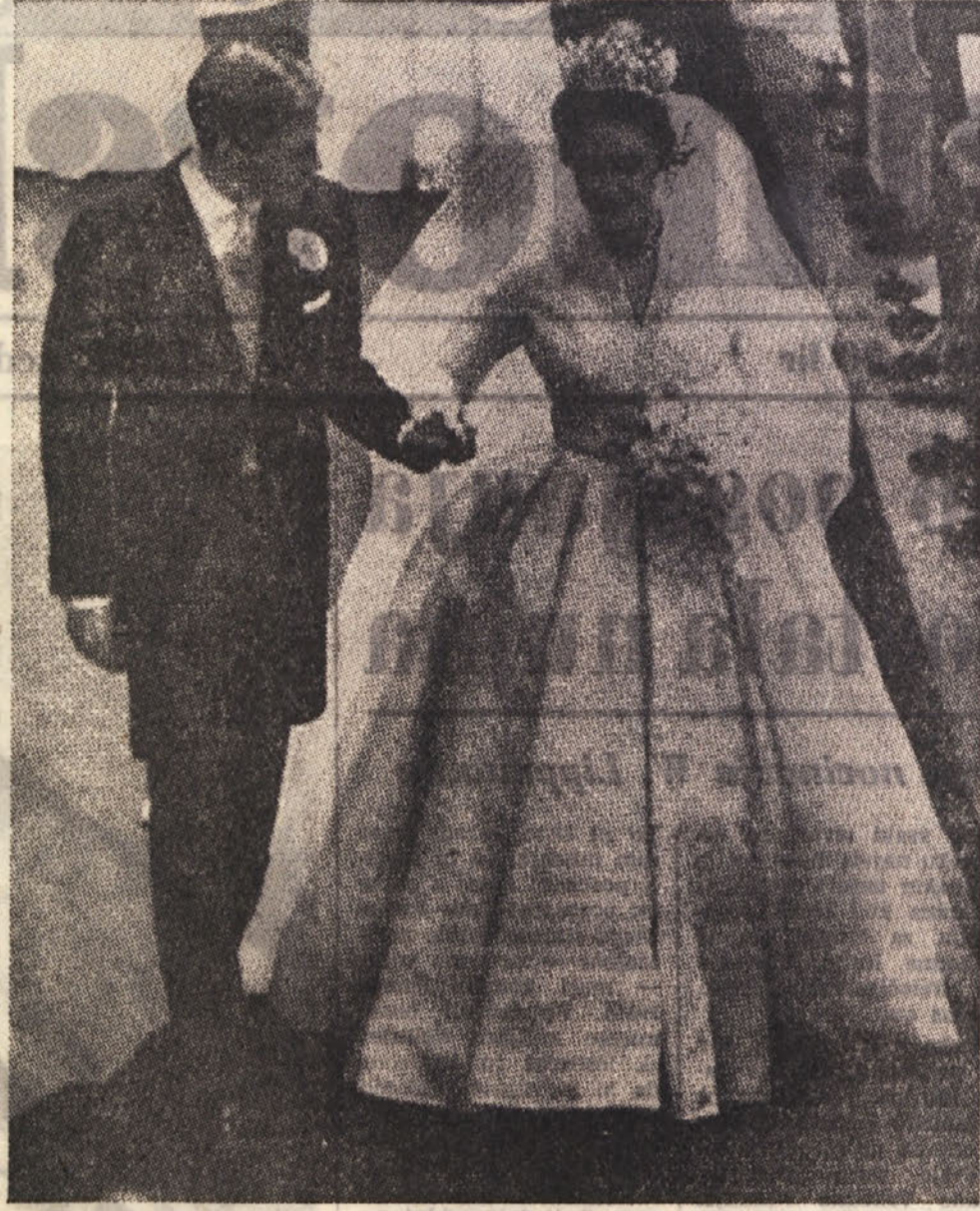
Princesa Margaret in Antony Armstrong-Jones zapuščata katedralo Westminster...