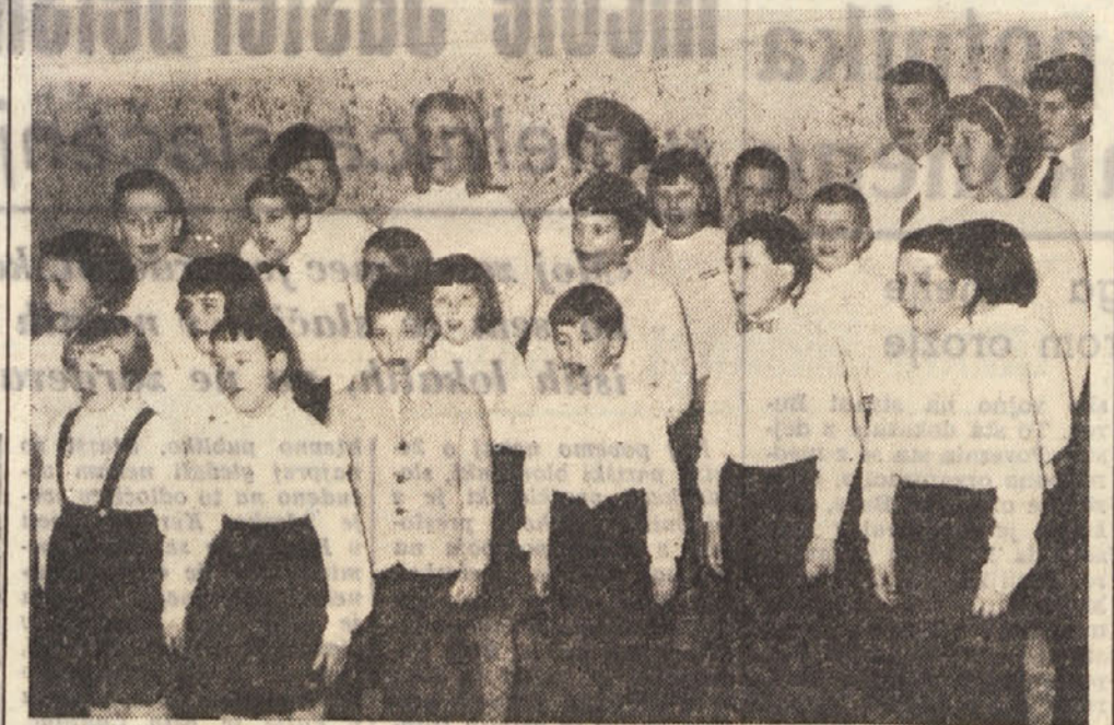
Otroci, ki jih vidimo na sliki, so člani mladinskega pevskega zbora prosvetnega društva 'Igo Gruden' iz Nabrežine...