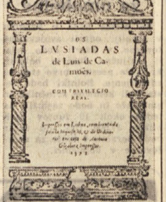
Naslovna stran prve izdaje Camoesovega epa.