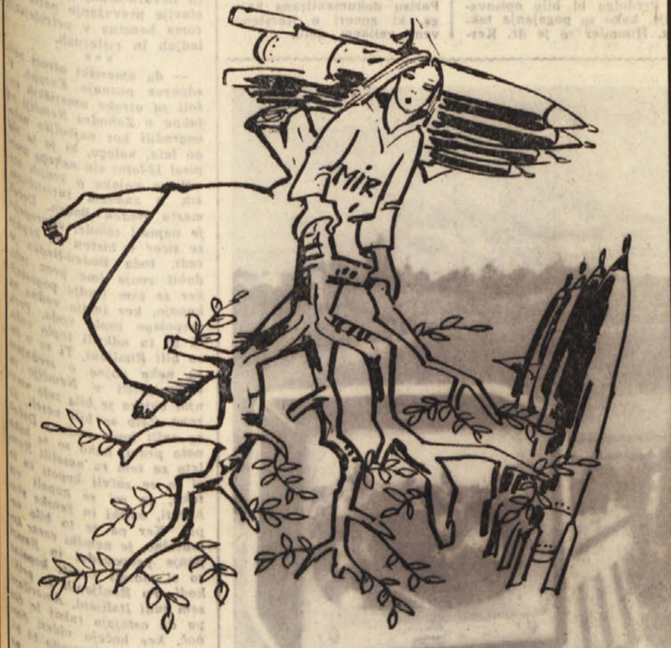
«Spritico velikih nesoglasij, ne bi moje oljčne vejice niti opazili»