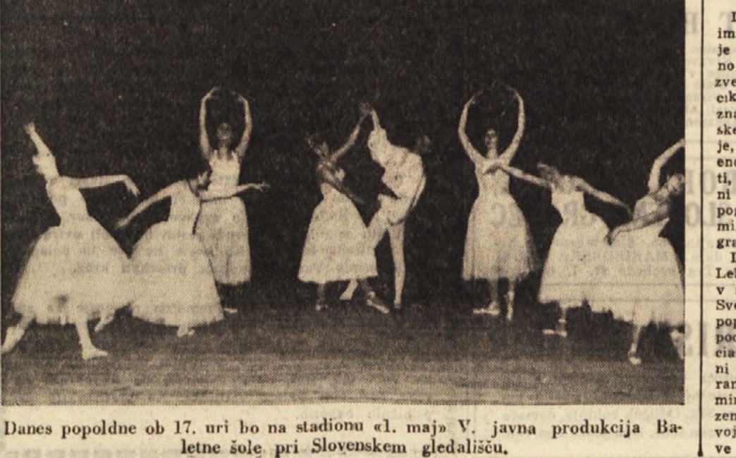
Danes popoldne ob 17. uri bo na stadionu «1. maja» V. javna produkcija Balletne šole pri Slovenskem gledališču.

«Moje spoštovanj!» pravi Sjusin in s prsti mglja pred belim gobčkom. «Cast mi se predstaviš se. Dovolj!»