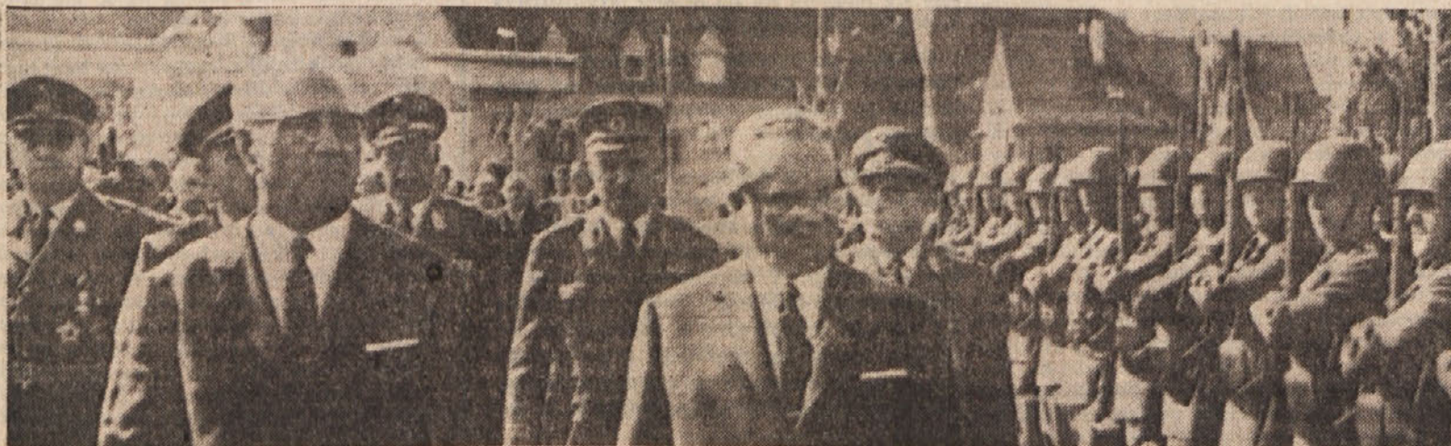
Predsednik Jonas in Tito sta bila na obeh straneh moje prisrčno spojele

Tako složno in odločno izpričani volji ameriškega ljudstva se tudi predsednik Nixon ne bo mogel več dolgo upirati.