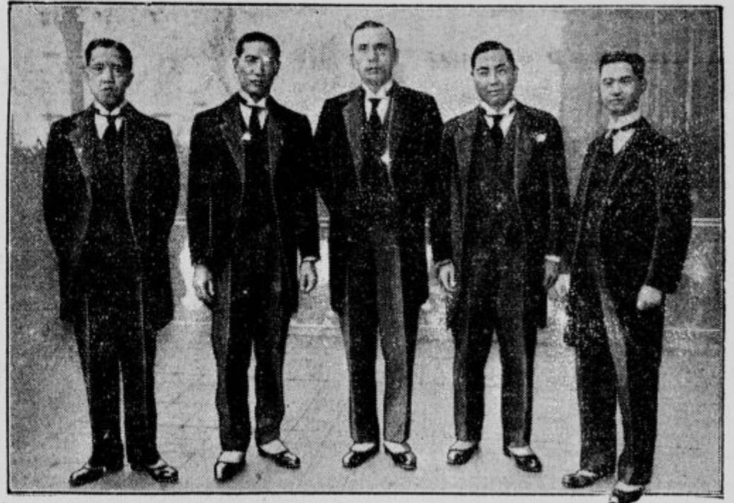
Kitajska mornariška komisija pod vodstvom admirala Tu-kaj-Kuci (v sredi), ki hoče reorganizirati kitajsko mornarico, je prišla v Evropo, da tu proučuje mornariške naprave.

Minister z izjavo zdravnika seveda ni bil zadovoljen in je zahteval, naj podrobneje utemelji. Zdravnik je odgovoril, da ni samo on, marveč da je tudi več drugih zdravnikov že dalj časa opazilo znake umobolnosti. Na sestanku zdravnikov, ki se je te dni vršil, je bilo sklenjeno, da se to ne bo več skrivalo pred javnostjo. Odločitev v tem vprašanju je prepuščena ministrskemu predsedniku. Jonsson je odličen politik, katerega na vsem Islandu imenujejo »močnega moža«. Je zelo priljubljen, tako da so ta odkritja povzročila veliko razburjenje.