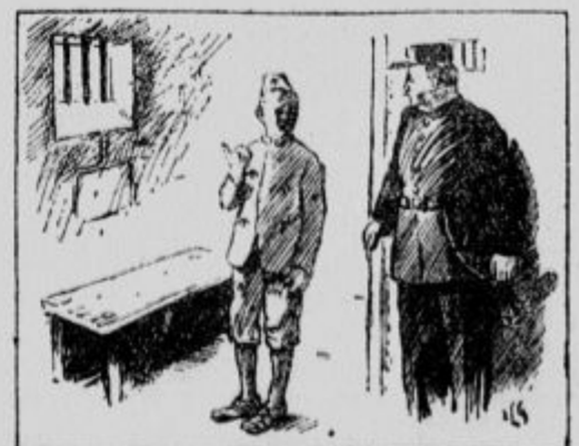
Novi jetnik: »O — železno omrežje? Se paš bojite vlomilcev?«

»No, ali mislite, da je Vaš morda lepši?«