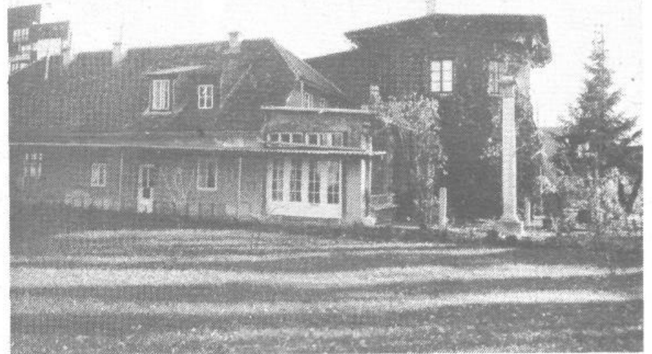
V Plečnikovi hiši na Karunovi 4 na Trnovem je na ogled za vse okrog 1100 predmetov tega velikana slovenske kulture ter nad 3000 dokumentov in stvaritev za strokovnjake posameznih področij. Vse večje bogastvo pa predstavlja tudi zbirka Arhitekturnega muzeja, ki domuje v številnih, svojevrstnih prostorih. Direktor in kustosi Arhitekturnega muzeja pa obiskovalcem prav radi spregovorijo o ureditvenih oseh, ki so vodile vizuelno iz Plečnikove hiše v številne dele Ljubljane.

Vrnimo se na Karunovo 4. Tu je v Plečnikovem domu Arhitekturni muzej. Nad 1.100 drobnih predmetov, ki jih je uporabljal pri delu in življenju tvorec navsota projektantom: »Oblači se skromneje, kakor ti gre, jej, kot ti gre, stanuj pa boljše, kot ti gre!« je na ogled vsem, ki želijo videti zapuščino moža, ki je 1921. leta prevzel stolico za arhitekturo na novo