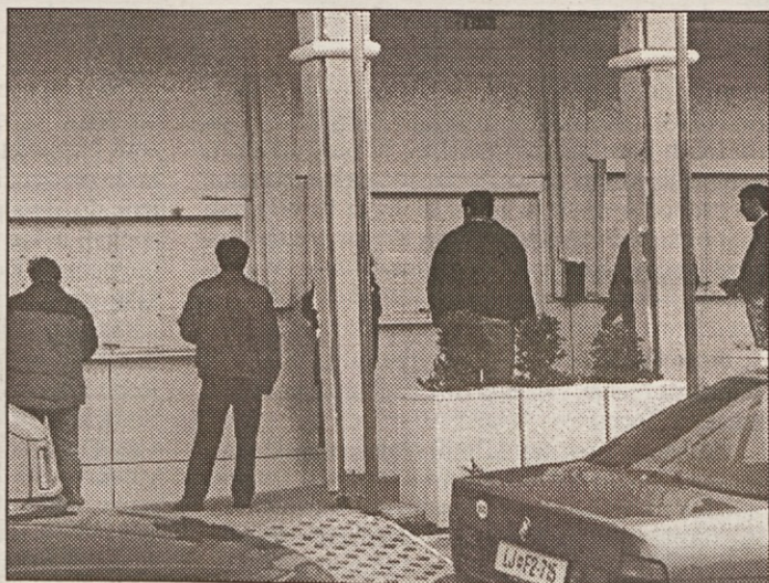
Iskanci dela so z novim pravilnikom o aktivni politiki zaposlovanja deležni večje pozornosti in pomoči države, tudi materialne. Nova oblika ustvarjanja delovnih mest so tako imenovane kooperative.

četku poslovne poti, podjetnikom v težavah ali brez ustreznega znanja o upravljanju človeških virov. Ciljna "publika" so predvsem mali in srednji podjetniki in podjetniki s kadroviskimi težavami.