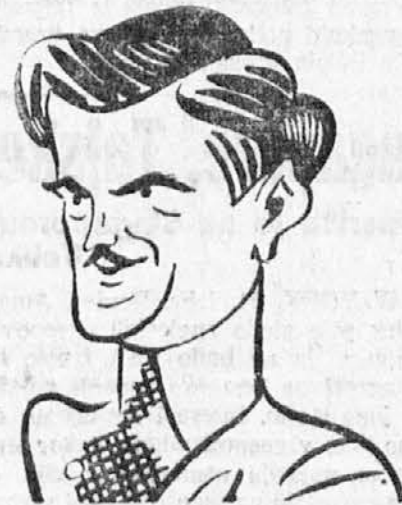
EDEN SPET POTUJE

NEW YORK, 21. febr. Ass. Press. Kakor se izve, je sodeloval pri razprstitvi angleškega konvoja pri Madeiri nemška 10.000 tonska »žepna križarka«. »Admiral von Sheer«.