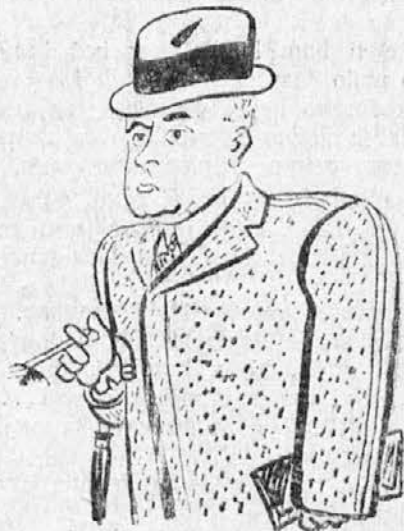
Sovjetski poslanik v Berlinu in pomočnik ljudskega komisarja za zunanje zadeve