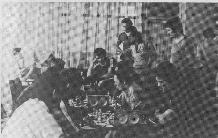
Tekmovanje v šahu in II. mesto.

tate v razvoju samoupravnih družbeno-ekonomskih in političnih odnosih, posebej še po II. svetovni vojni in v zadnjih letih intenzivnega gospodarskega razvoja.