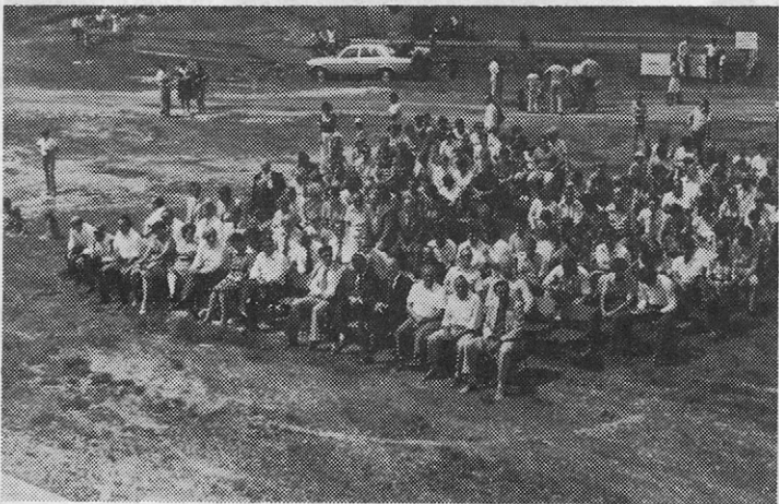
Udeleženci srečanja v Podljubelju.

Na referendumu 10. 11. 1977 smo se odločili za organiziranje novih TOZD KOMERCIALA in ORODJARNA s 1. 1. 1978 in tako smo letošnje jubilejno leto pričeli organizirani v osem temeljnih organizacij in delovno skupnost skupnih služb.