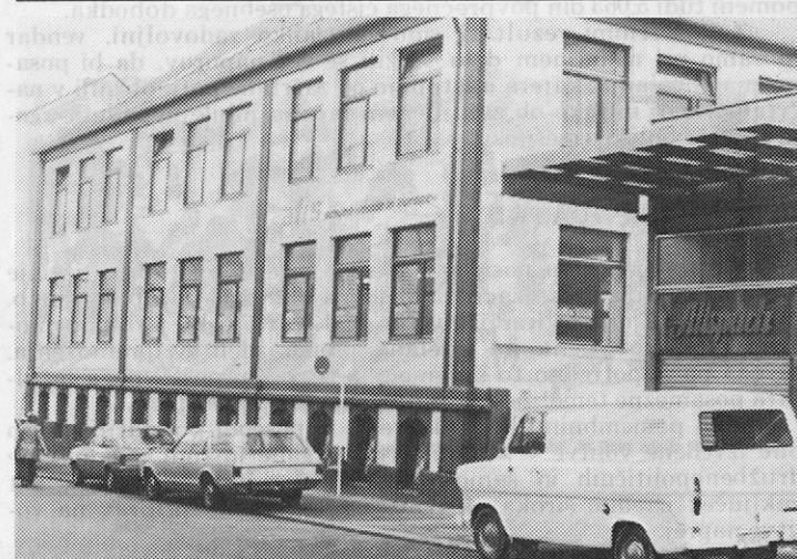
Poslovna zgradba AFIS