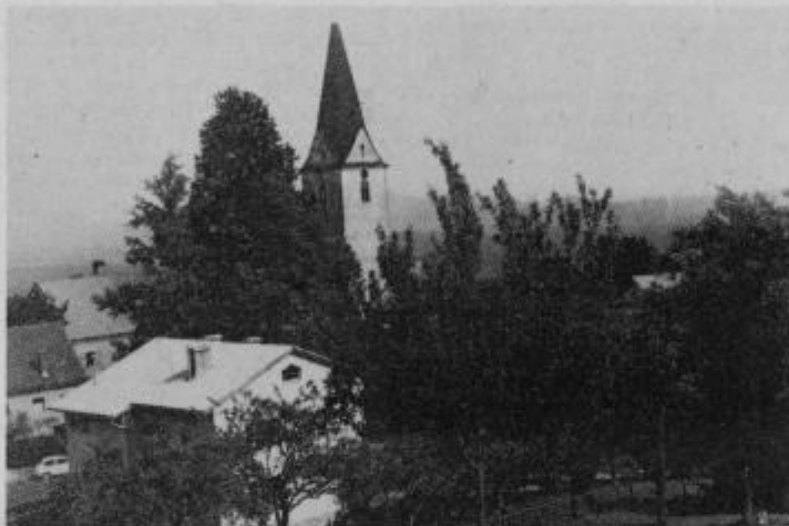
Partizanska vasica Kebelj

rili ali počivali v zavetiščih in si pomagali z obleko in hrano. Strah pred izdajstvom je bil odveč, sicer pa so okrog hiše imeli zanesljivo stražo domačinov.