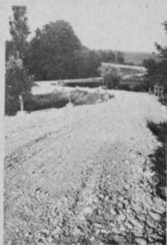
Z vitanske strani je bilo nekaj težav prav na tem odseku, kjer je nekakšno kogovsko tromostovje. Sedaj je tudi tu že asfalt.

Štefana Lukmana na Kogu in okolici vsi poznajo. Star je 69 let in preživlja 4 družinske člane (vsi stari nad 60 let) na enem hektarju zemlje. Podpisal je za 250.000 SD: „Rad sem dal za cesto; raje kot bi kaj kupil za v hišo. Mi smo vsi že stari in vsi radi gremo po lepi poti. Prej je bila cesta močno gramozirana pa nisem mogel s kravami po njej voziti, sedaj se bom lahko pešjal na njivo in v gozd po lepi cesti, to mi veliko pomeni. Nekaj nad