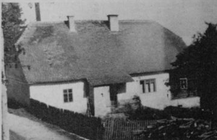
Fakučova domačija, kjer je bil miting