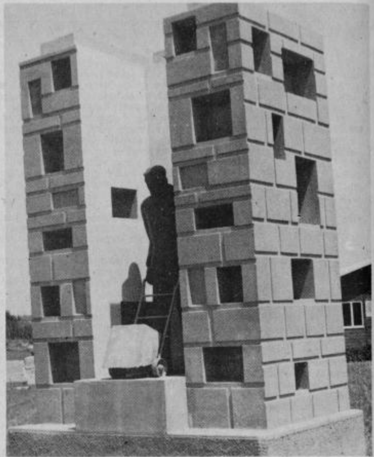
Spomenik skladiščnemu delavcu