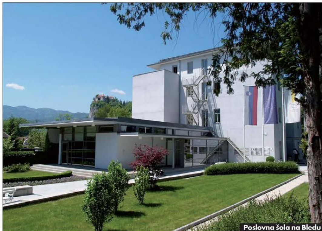
Poslovna šola na Bledu