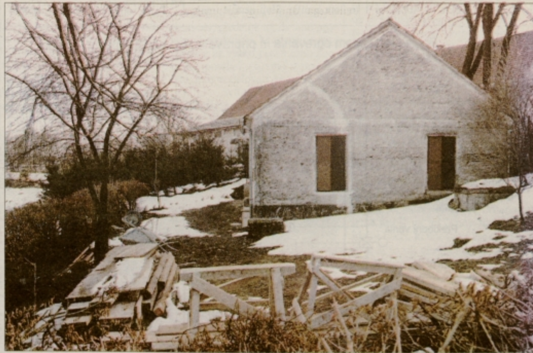
Prvi mitrej na Spodnji Hajdini, do katerega ptujski pokrajinski muzej v sto letih od odkritja ni uspel urediti dostopa.