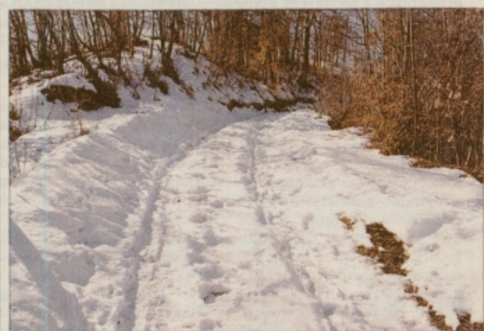
Sneg na tem delu ceste Janški Vrh - Slape so omadeževale le človeške stopinje, snežnega pluga pa žal ni bilo