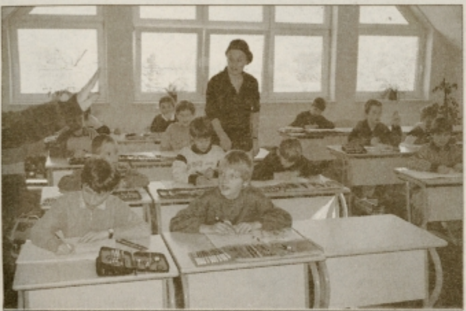
»Prvi dan pouka v mansardnih učilnicah je enkrat en,« so zatrtili najmlajši na šoli Mladika

PTUJ / SODELOVANJE RADIOAMATERJEV S POKLICNO IN TEHNIŠKO ELEKTRO ŠOLO