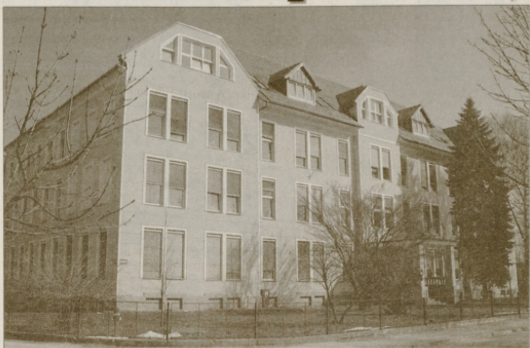
Tako je po obnovi ostrejša videti šola ob Dravi; sprednji del ob vhodu bodo kmalu uredili z zelenjem in klopami.

Z dokončanjem obnove šolske zgradbe bodo na Mladiki v prihodnjih mesecih pridobili še knjižnico s sodobno čitalnico v pritličju šole, lotili se bodo prenovne kuhinje in širitve jedilnice, po besedah ravnateljice Purgaje-