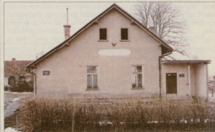
"Občinska stavba", ki to ni.