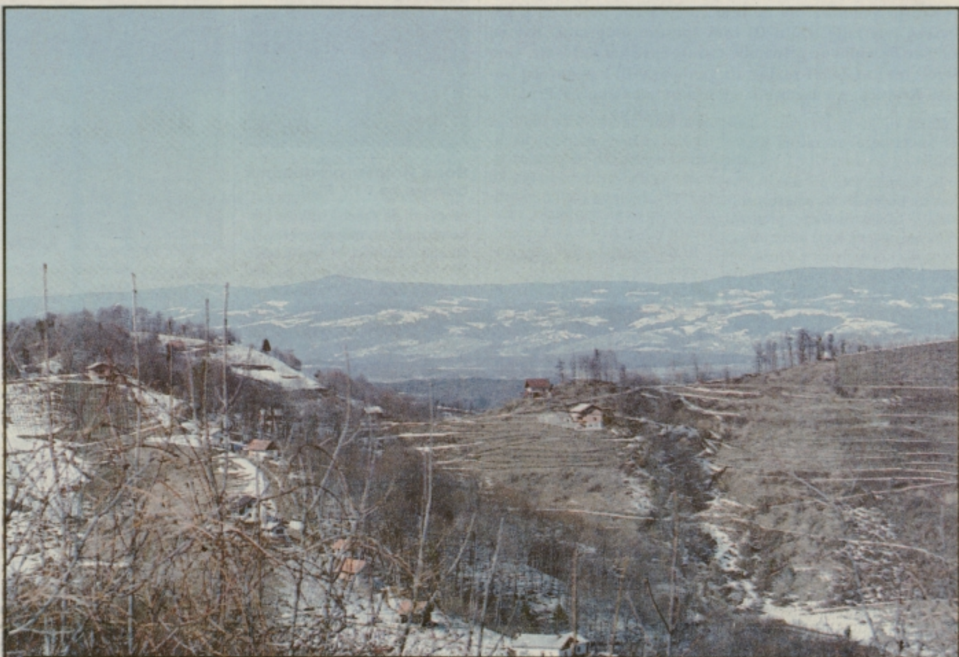
Zimsko-pomladna haloška razglednica.