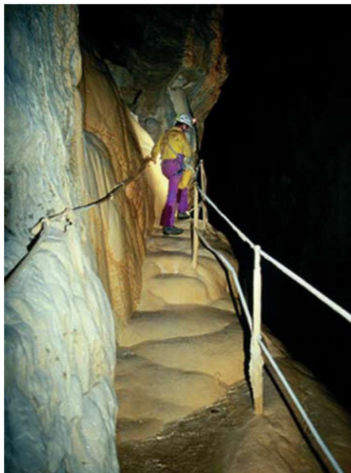
Slika 3: 120 let stare poti v Škocjanskih jamah so danes marsikje že na debelo prekrte s sigo.

To pa ne velja le za Škocjanske jame, ampak za Kras nasploh. Razen tipične kraške pokrajine, ki je dala ime pojavu, je prav človek in njegovo delo, njegovo prilagajanje kraški pokrajini, njenim možnostim in njenim virom, tisti razlog, da je Kras vpisan