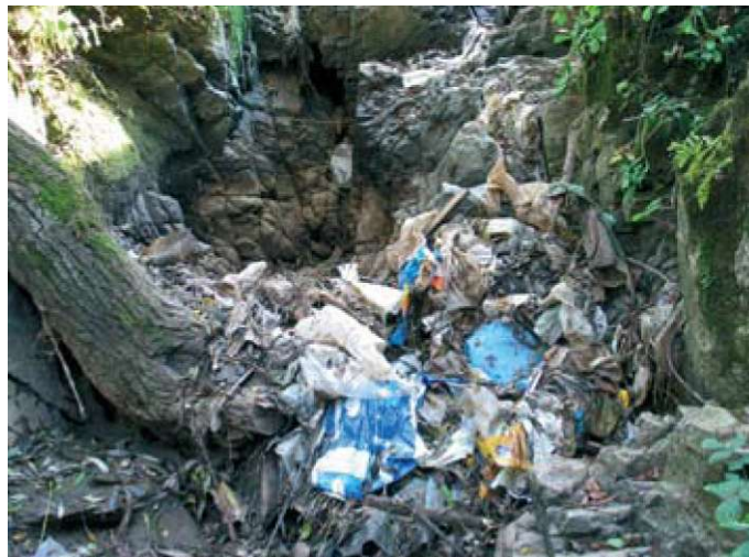
Slika 5: Kaj vse odnaša voda v kraško podzemlje (foto A. Kranjc).

Kras je prva, najbolj severozahodno ležeča in tipična dinarska planota. Razprostira se v "dinarski" smeri (od jugovzhoda proti severozahodu) in v tej smeri tudi pada, od 450 m n.m. okoli Divače do okoli 150 m na skrajnem severozahodu (Šmartin). Kras dobiva vodo na dva načina: t.im. razpršeni (difuzni) dotok, to so padavine, ki padajo na površje in sproti ponikajo v kraško notranjost, ter zgoščeni ali koncentrirani dotok, to so površinski tokovi, ki pritekajo z neprepustne okolice in na stiku s Krasom ponikajo. Poleg že večkrat omenjene Reke so to še nekateri stalni ali občasni potoki kot sta npr. Senožški potok in Raša. Nekateri potoki ponikajo dlje od Krasa, a voda vendarle teče podzemeljsko v vodonosnik Krasa, kot so npr. vode iz Košanske doline in celo Sajevški potok s Spodnje Pivke [Kranjc, 2004a: 485-486]. In kar je morda manj znano, kjer se reka Vipava približa apnencu v vznožju Krasa, del njene vode (preko 1 m 3 /s) prenika v vodonosnik Krasa, ob posebnih razmerah pa zateka v Kras tudi talna voda iz soškega aluvija - Furlanske ravnine [Petrič, 1999]. Zato je v izviri, ki jih napaja vodonosnik Krasa, precej več vode, kot pa bi je bilo, če bi bil ta odvisen le od padavin. To ima svojo dobro stran, to je velike količine vode. Slabo pa je, da površinski tokovi, ki ponikajo v Kras, tečejo skozi naseljene kraje in so bolj ali manj onesnaženi. Dokler se v 80-tih letih prejšnjega stoletja razmere v bistriški industriji niso bistveno