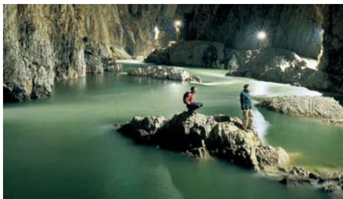
Slika 2: Narasla Reka v Škocjanskih jamah.

Ena od značilnosti in ena pomembnejših lastnosti krasa je tudi kraški, to je podzemeljski, odtok. Ni pravega, popolno razvitega krasa brez kraškega odtoka: padavine, ki padejo na apnenčevo površino skozi razpokano kamnino prenikajo v kraško notranjost, v podzemlje. Če priteče reka ali potok z neprepustnega (erozijskega) sveta na prepustnega, to je na karbonatne (kraške) kamnine, prej ali slej ponika v podzemlje. Ponika lahko skozi razne ponikve in požiralnike, včasih pa tudi v prav mogočne ponorne (tudi ponor je prešel v mednarodno izrazoslovje) jame. Med najlepše primere ponornih jam sodijo Škocjanske jame, delo Reke. Reka ima kraške izvire pod Snežnikom, večji del njene doline je vrezan v neprepustne flišne kamnine, na stiku z apnencem Krasa pa ponika v Škocjanske jame.