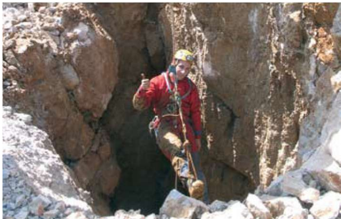
Slika 7: Ob gradbenih delih se odpirajo novi vhodi v podzemlje (foto Arhiv Inštituta za raziskovanje krasa ZRC SAZU).

Figure 7: Construction works reveal new entrances to the underworld (photo: Karst Research Institute ZRC SAZU archives).