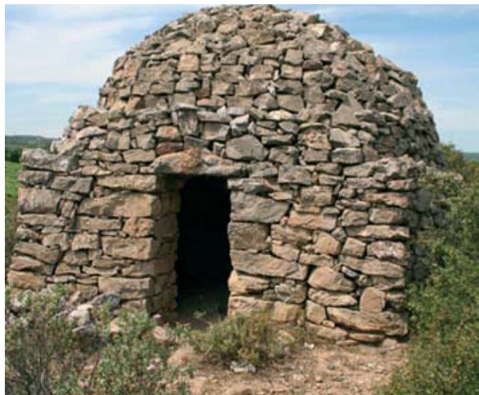
Slika 4: Kraška hiška je tipični primer sredozemske vernakularne arhitekture.

Menim, da je iz povedanega dovolj jasno, zakaj je Kras tako pomemben in zakaj ter kaj moramo varovati, ne le kot našo, ampak kot svetovno dediščino: njegovo površje s kraškimi pojavi, njegovo podzemlje in Škocjanske jame ter kraško vodo še posebej. Za prebivalce Krasa in tudi širše okolice je podzemeljska voda, vodonosnik Krasa, življenjsko pomembna. Vodonosnik Krasa je ogromen vodohran pitne vode [Kranjc 1994]. Kraški vodovod, ki črpa vodo iz tega vodonosnika, oskrbuje z vodo celotno območje Krasa ter deloma tudi prebivalstvo Trsta in naselij ob Tržaškem zalivu, po potrebi pa pomaga blažiti poletno pomanjkanje vode na slovenski obali. Dobra milijarda m 3 vode, kolikor je letno priteče na površje iz vodonosnika Krasa, bi