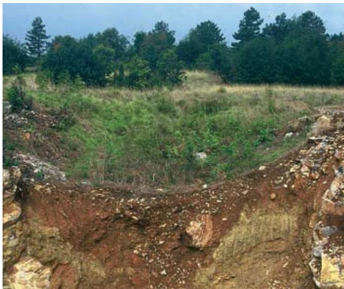
Slika 6: Tudi izkopavanje prsti iz vrtač, koristno za vinograde, ni v prid ohranjanju tipične kulturne krajine Krasa.

Ko Reka izgine pod površje, svet nad jamami in v okolici ter navzdol po Krasu ni več "porečje Reke" in torej ni več vplivno območje Škocjanskih jam. Pod Divačo je Kačna jama, tretja najdaljša v Sloveniji, ki jo bodo jamarji prej ali slej povezali s Škocjanskimi jamami - morda bo to najdaljši jamski splet v Sloveniji. Vendar bo večji del popolnoma nezaščiten, ker bo izven parka. Parku oziroma jamam pa grozi še druga nevarnost. Tako po Krasu kot v neposredni okolici Škocjanskih jam je svet razmeroma poceni, v bližini so pa močni centri