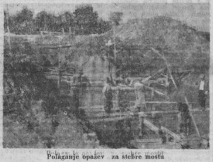
Polaganje opazev za stebre mostu