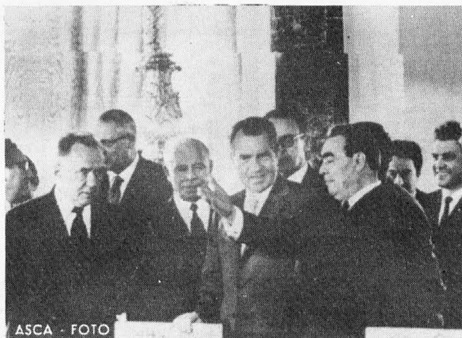
Velika ruska »trojka« Kosigin, Podgorni in Brežnjev v razgovoru s severnoameriškim predsednikom Nixonom. Za Nixonom njegov osebni svetovalec Henry Kissinger