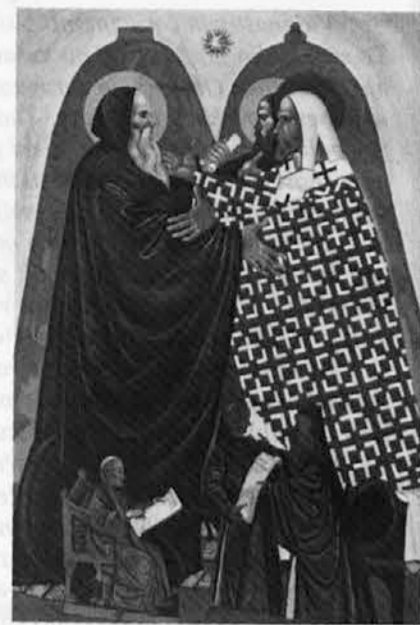
Sv. brata Ciril in Metod

ljudstva prvič zavedati svojega poklica, da v vesoljnem načrtu za rešenje sveta sodelujejo pri večnem načrtu presvete Trojice« (str. 29). »Vse kulture slovanskih narodov so namreč za svoj začetek ali svoj razvoj dolžnice delu obeh solunskih bratov. Saj sta s tem, da sta na izviren in genialen način ustvarila za slovanski jezik abecedo; dala svoj temeljni prispevek