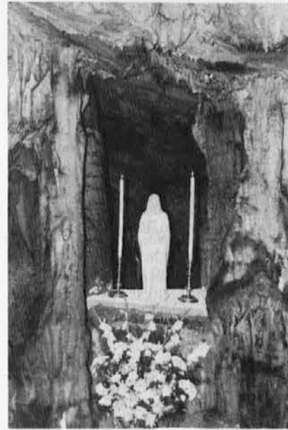
Kip Matere Božje v Pečini

man pa je sklenil, da bodo vsako leto obhajali spomin na ta dan z mašo v Pečini. Da se je to zgodilo pa smo morali čakati več kot štirideset let, saj smo komaj lansko leto obnovili staro navado praznovanja svečnice v Pečini. Pečina se je tako po dolgem snu spet zbudila in z njo vred je oživela tradicija, ki je z leti zamrla. Domačini so se ob tem dogodku navdušili in v jamo postavili Marijin