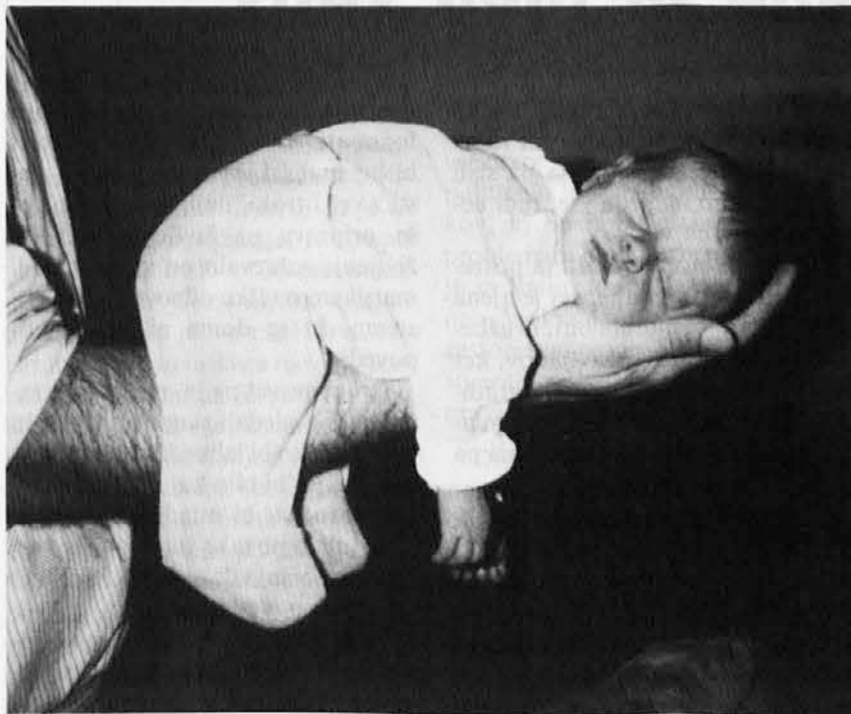
v topli očetovi dlani