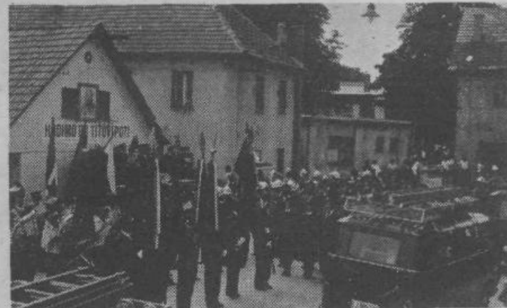
Pred slavnostnim odrom so se zbrali gasilci iz vseh društev naše občine