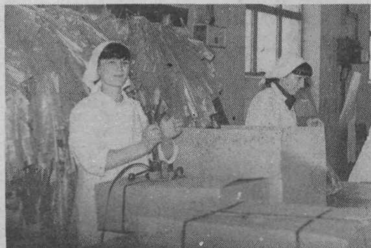
V TMI, Mesarska 1, pripravijo letno okrog 5500 ton mesa in 3500 ton mesnih izdelkov. Lani so s tem pridobili 1,32 milijarde dinarjev prihodka. Precejšen del so ga ustvarili tudi z izvozom v dežele v razvoju. Na sliki: pakiranje mesa in mesnih izdelkov v TMI za izvoz