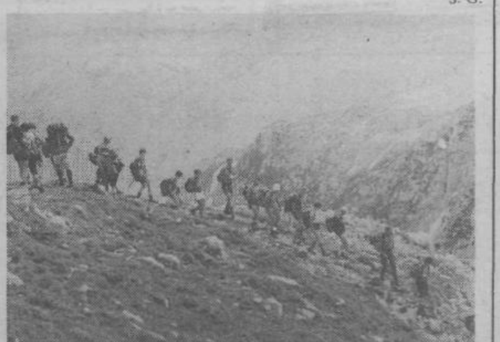
Del stotnje Saturnužanov ob sestopanju s Krna

gusta na Monte Cavallo v Italiji, 22. avgusta na Veliko Rateško Ponco in 29. ter 30. avgusta na Špik. V septembru se bodo Saturnužani udeležili zbora planincev, ki bo 14. septembra; 20. septembra bodo šli na Kepo, 27. septembra pa na Veliki Draški vrh. Vmes bodo še akcije prostovoljnega dela pri gradnji koč na Veliki planini. S. G.