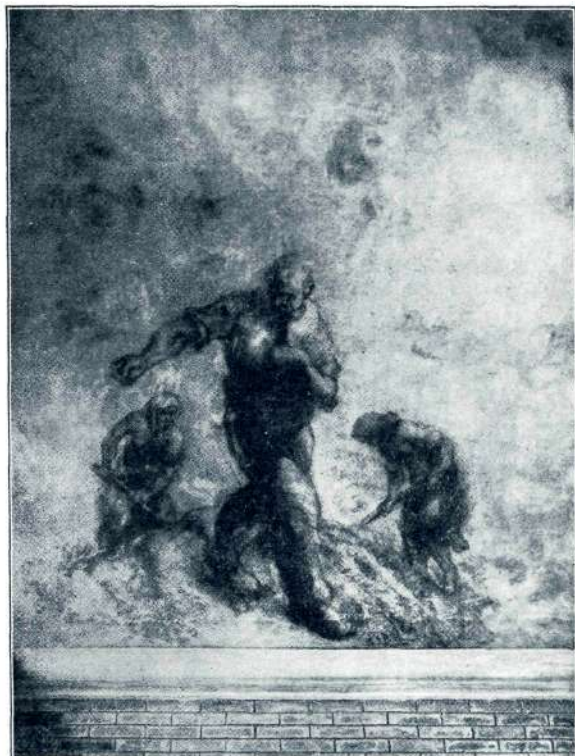
R. JAKOPIČ: DOMAČIJA