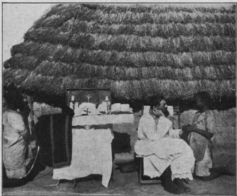
Misijonar pride v samotno zamorsko vas. Pred borno kočo postavi prenosni oltar, da opravi sveto mašo. Poprej pa spove svoje zamorske kristjane, kar nam predstavlja zgornja slika.

Kadar pride pater na kako zunanjo postajo, zlasti, ako je bolj v središču, prihitijo kristjani iz vse okolice, često po 20 km daleč, večinoma peš. Tudi prvi petek v mesecu se v čast presv. Srcu Jezusovemu tukaj zelo slovesno obhaja in je ta dan mnogo ljudi pri sv. obhajilu.