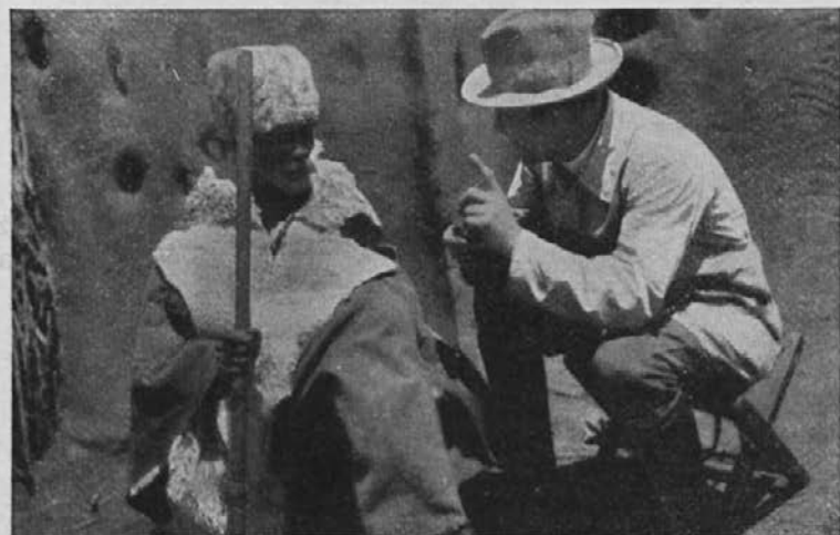
Misijonar poučuje starega zamorskega poglavarja v sveti veri.

Ravno 25 let je preteklo, odkar smo z največjo težavo in ob pomanjkanju vsega ustanovili misijonsko postajo Nyangana ob Okawango. Prebivalci tega kraja so bili že od njega dni pogani. Počeščenje prednikov: to je bila vsa njih vera in služba božja. Neutrudno smo poučevali ljudi v krščanskih resnicah, pa šele čez dolgo časa se jih je zglasilo dvanajst, ki bi bili radi krščeni. Polovico se jih je po nekaj dneh vrnilo nazaj v poganstvo; novih pa se ni zgl-