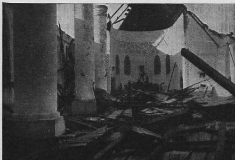
Od viharja porušena misijonska cerkev.