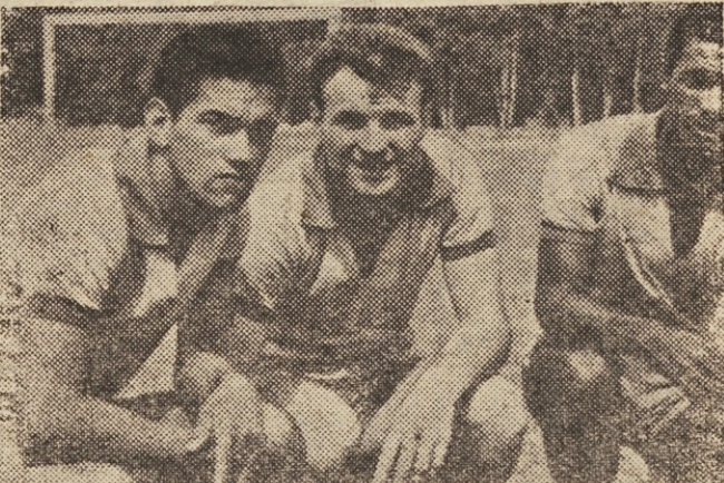
Se spominjate velikih nogometašev — Garincha, Mazzola in Didi, ki so bili med najboljšimi v enajstotici Brazilije, ki je leta 1958 osvojila svetovno prvenstvo na Švedskem. Vse kaže, da Brazilcem tudi prihodnje leto nihče ne bo kos

Na koncu so se določili, da bo srečanje med nogometnimi reprezentancama Slovenije in Koroške 18. novembra v Celovcu.