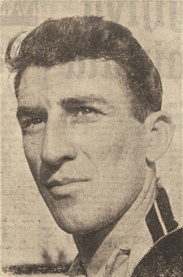
Djani Kovač še vedno razveseljuje prijatelje atletike in je požel dve lepi zmagi na gostovanju v Italiji. Posebno v Rimu, kjer je na mednarodnem mitingu dosegel nov državni rekord na progi 400 m. je postal predmet zanimanja mnogih evropskih atletskih strokovnjakov