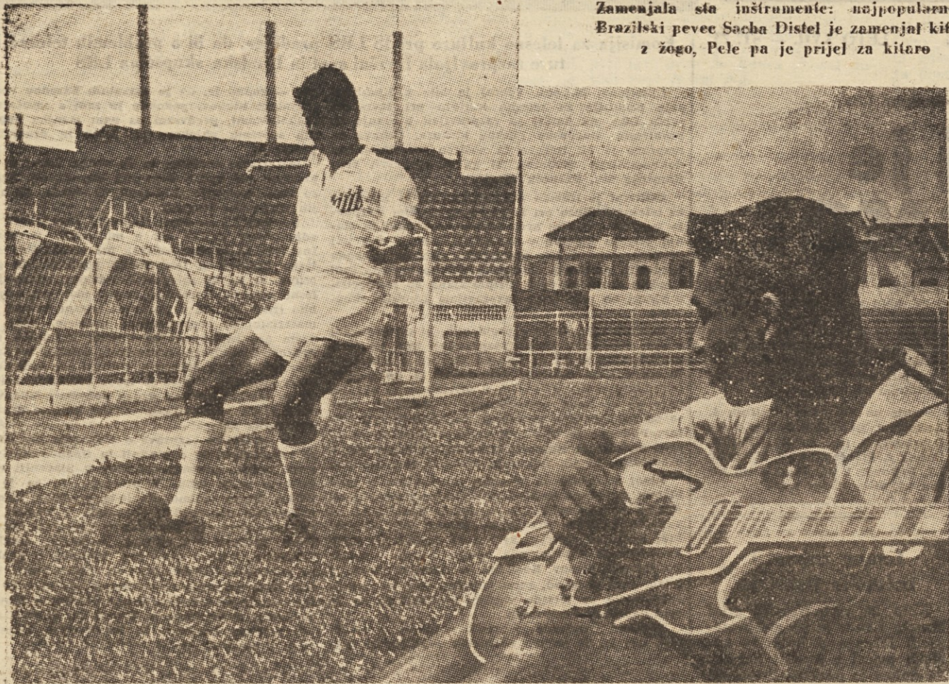
Zamenjala sta instrumente: najpopularnejši Brazilski pevec Sacha Distel je zamenjal kitaro z žogo, Pele pa je prijel za kitaro

Srečanje Avstrija : Jugoslavija v Zagrebu eden največjih nogometnih dogodkov letošnjega leta — Kako se pripravljajo za svetovno prvenstvo v Čilu? — Vstopnice za svetovno prvenstvo bodo prodajali že februarja