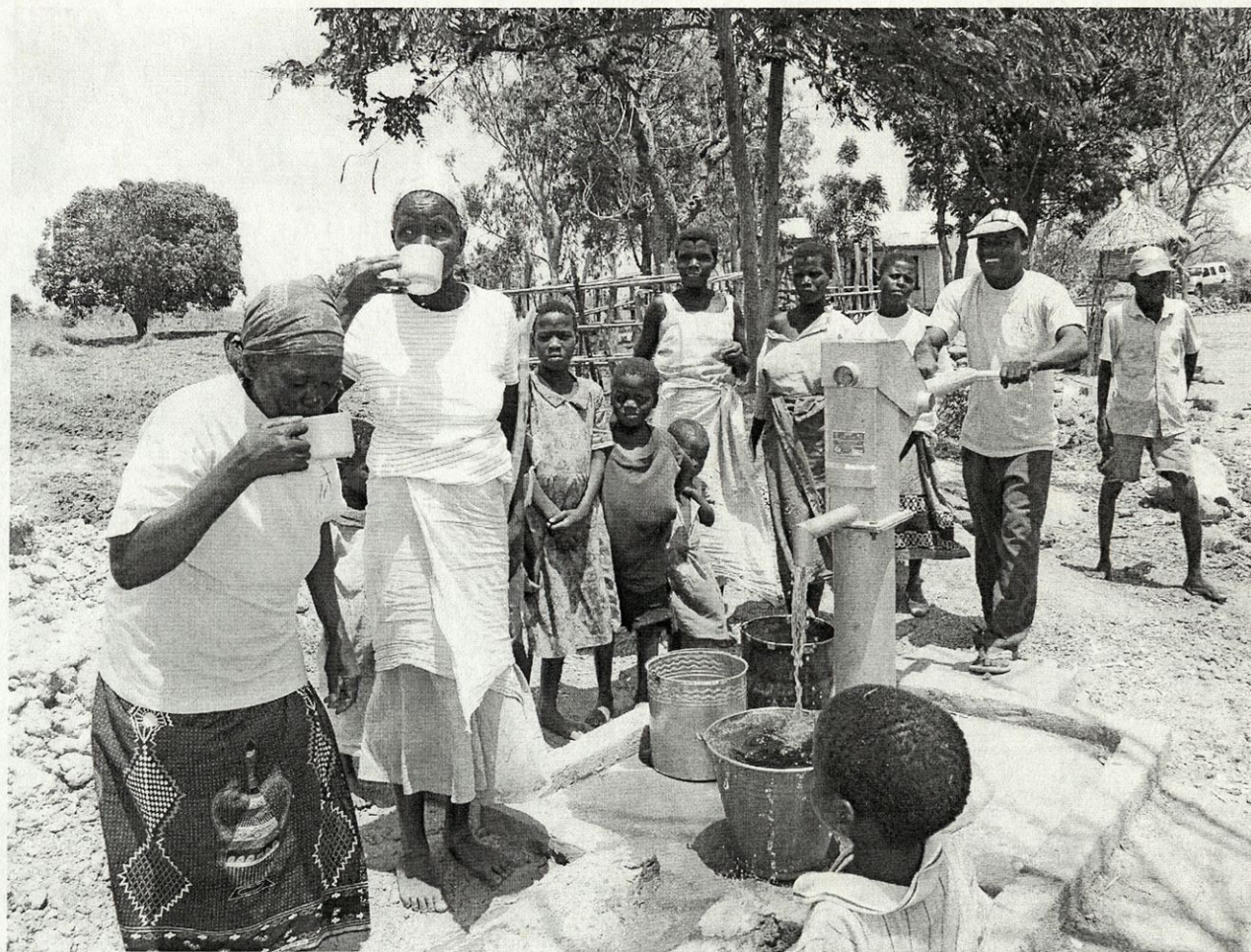
Vaščani v Mua, pri Bwanalijevih, pijejo čisto vodo

POZDRAV IN PRIPOROČILO VSEM PRIJATELJEM MISIJONOV!