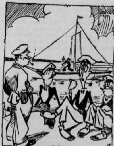
»Oprostite, ali spadate morda vi k moštvo tistele jadrnice?« »Ne, mi smo lastniki. Moštvo pa pometta krov.«

★ »Kaj, 60 Din hočete na dan za tole sobo?« »Seveda; pomisliti morate, kako krasen razgled imate s teh oken.« »Prav lahko mi spustite dva kovača! Saj morate upoštevati, da sem kratkoviden.«