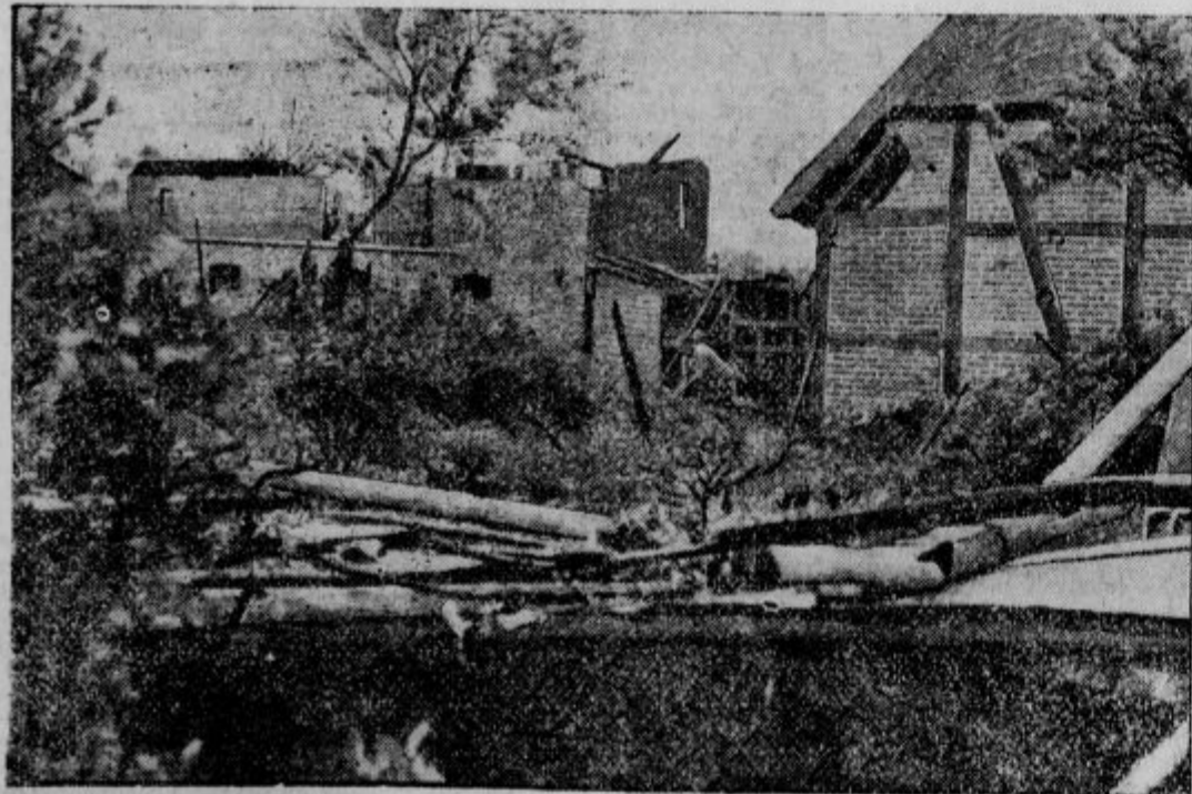
Ciklon v Nemčiji. V okolici Harburga v Nemčiji je te dni divjal vihar, ki je bil tako silen, da je raval drevesa in razkrival hiše.

Danes zna že vsak pisati in prav gotovo pišemo mnogo preveč, zlasti nepotrebnega v času kisljih kumarov. Tiskarniški vajencec Neki pa je v Berlinu hotel doseči prav poseben rekord. Hotel je napisati čim več besed na navadno dopisnico. Tako je pred nekaj leti napisal 8442 besed na dopisnico in s tem dosegel svetovni rekord. Lansko leto pa mu je rekord odvzel neki Španec, ki je napisal na razglednico 9000 besed. Izguba naslova rekorderja je tiskarniškega vajenca tako bolela, da se je znova lotil drobnega pisanja na dopisnico. Celih 17 ur je pisal na eno samo dopisnico in spravil nanjo 10.111 besed. Le škoda, da mu ta svetovni rekord ni povrnil niti stroškov, ki jih je imel, ko je kupil dopisnico.