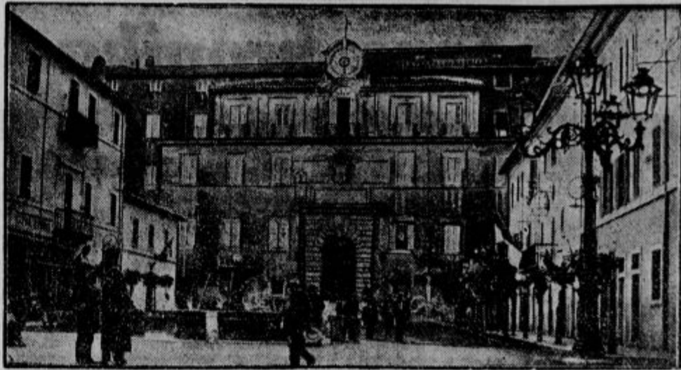
Papež na počitnicah. Papež Pij XI. bo koncem avgusta odšel na počitnice v Castell Gandolfo, kjer so od srede 17. stoletja do l. 1870. bili papeži vsako leto na počitnicah. Papež Pij XI. pa bo ostal v Castell Gandolfo le malo časa.