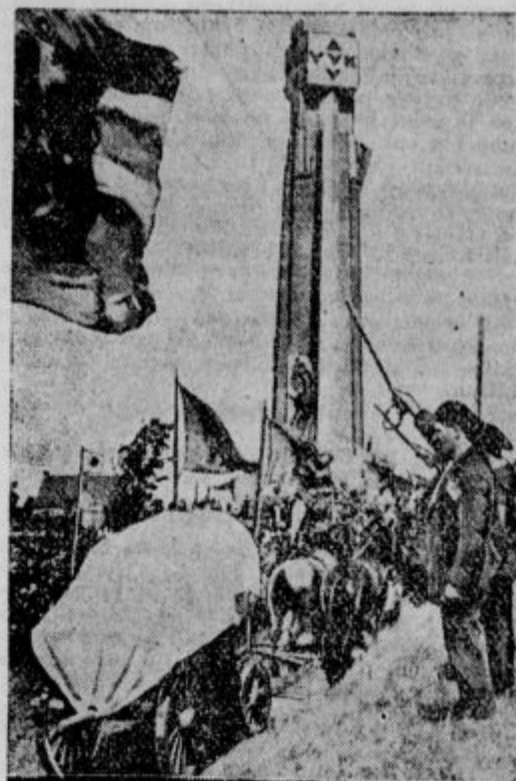
Flameci v spomin v vojni padlim. Te dni se je zbralo 250.000 Belgijcev Flamecev pred 50 m visokim nagrobnim spomenikom, postavljenim v spomin vsem Flamecem, ki so padli v svetovni vojni. Veliki spomenik stoji pri Dixmuidenu ob Yseri in Flameci so porabili veličastno zborovanje, da so manifestirali za popolno svobodo in enakopravnost Flamecev.