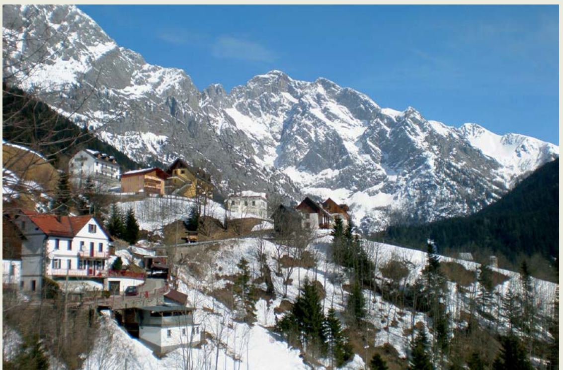
Vas Collina, ki je izhodišče za turo na Monte Coglians.

... je slovenskim turnim smučarjem sicer razmeroma dobro poznan turni smuk, saj ga opisuje že trijezični turnosmučarski vodnik iz leta 1977. Brez dvoma ga lahko označimo za vsestransko zahteven turni smuk. Zaradi južne lege in precejšnje naklonine v zgornjem delu je izpostavljen plazovom in zdrsom. Tako je absolutno treba ujeti dobre razmere, kar je v informacijski dobi postalo še najmanjši problem. Radost nad uspehom na turi se praviloma takoj podeli v spletnem medmrežju. Okvirno pa, ker prisegamo na stabilne razmere v klasičnem turnosmučarskem firnu, je to v marcu.