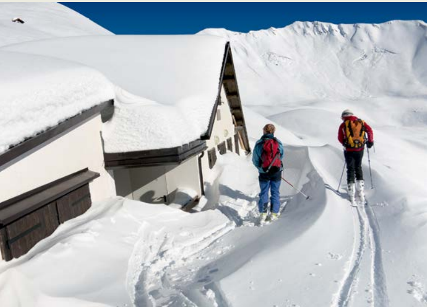
Casera Chiadins bassa pod Monte Crostisom

v Karniji srečali še t. i. jezikovne otoke staronemške manjšine v Sappadi/Plodnu, Saurisu/Zahru in Tima-uu/Tischelwangu. Poleg geografske, geološke, botanične je torej tu tudi izjemna kulturna pestrost, ki daje Karniji tako poseben pečat.