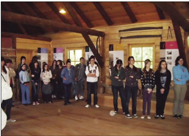
V plavajočem mlinu na Muri

Kot vsako leto, tudi letos nas je z nasmejanim obrazom in s polno vrečo bonbončkov pozdravila naša dvojezična spemljevalka v lepo zveneči slovenščini v Prekmurju. Na kratko nam je predstavila naš