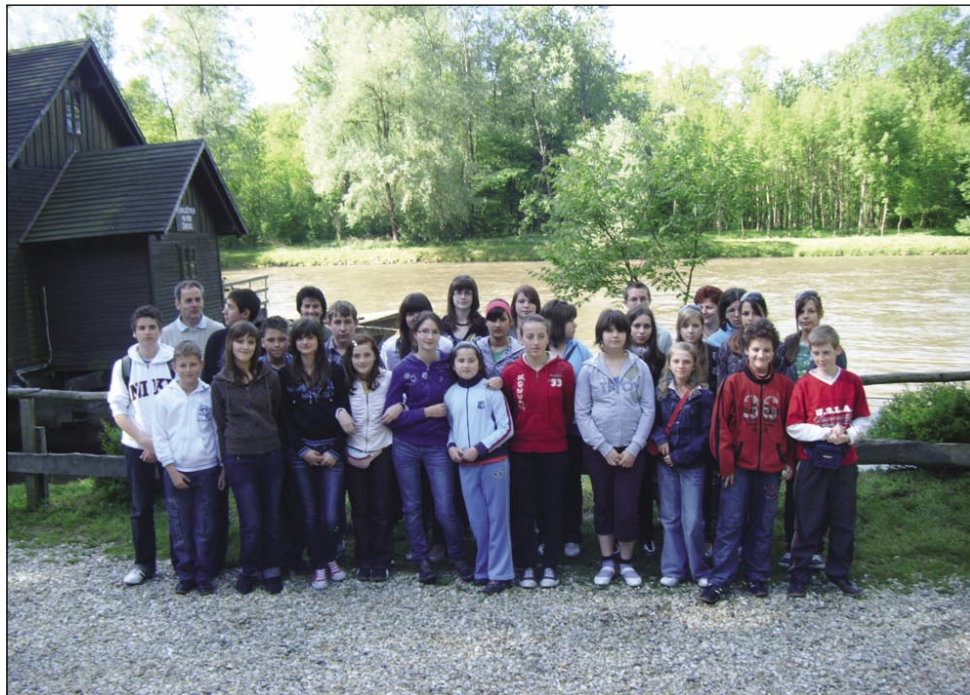
Izleta so se udeležili učenci osnovnih šol, ki so sodelovali na kvizih in tekmovanjih v slovenščini

njem in zanimiv film o težkem življenju »bujrašev«. Z brodom smo se peljali na drugi breg reke Mure in smo se (hvala Bogu) hitro pripeljali nazaj, ker je voda bila tako divja,