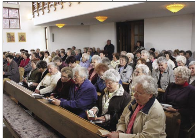
Prauška je bila v mejseci majuši, zatok so upokojenci vsepovsedik spejvali Marijine pesmi

takšo mesto in v takšne pokrajine, ka so povezane s Slovenci. Drugo leto se pa pelamo v Slovenijo. Zdaj smo se zgučali, ka si poglednamo varaš Lendavo pa okolico.