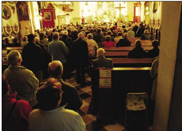
Pri sveti meši na Brezjah je bilau prevnaugo lidi

Pred prauškov cejli keden smo že samo tau poslušali po radijoni pa po televiziji, kakšno vrejmen baude v soboto. Kak so dnevi šli, tak smo mi volau zgibili, ka je od dneva do dneva slabšo vrejmen bilau. Ka mo zdaj delali, smo si zmišlavali, vrejčno de nam tak titi? Dapa če je že gnauk prauška, te mo šli, kakšno koli je vrejmen.