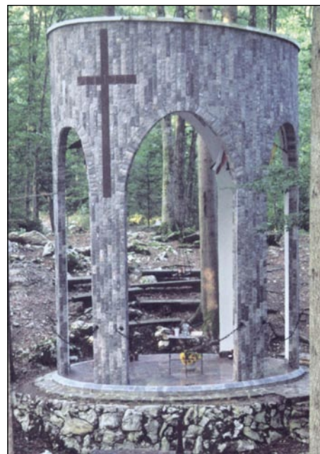
Mala kapejlica v spomin domobrancov

Na Kočevskom je funkcioneralo 24 špital, štere so nej vse v gna-kom časi delale, v ništernaj pa so samo malo cajta vračili. Prve