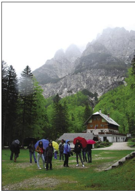
Pri Aljaževem daumi, od zar se vidi Triglav

Kak smo vse več serpentinov za sebov njali, v autobusi je tak vsig-