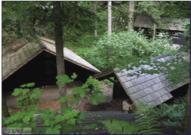
Med drügov bojnov so na Bazi 20 živeli pa merali partizange

V modernom cajti se tū pa tam eške najde divdjina. Na bregaj kauli varaša Kočevje rasté gaušta gaušča, skoro nega potokov, živé sploj malo lūdi pa nega prometni poštij. Pragozd (óserdó) pokriva tri frtale krajine, od drejv najdemo največ bük-