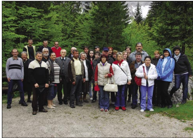
Andovčani pod Triglavom (Vrata)

Porabsko kulturno in turistično društvo Andovci pa Manjšinska samouprava Andovci sta 15. maja za Andovčane organizirala prauško na Brezje.