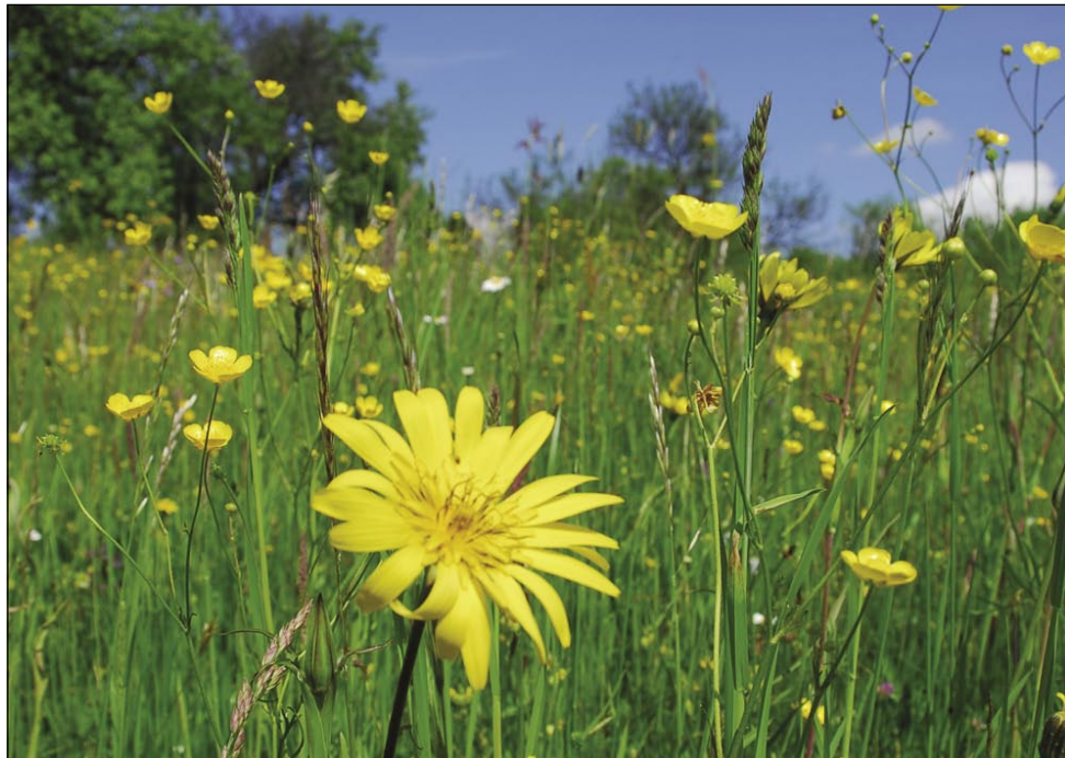
Porabska sprtolejt. V politiki tö?

Zatok smo se pa malo prese-netili, gda smo v planaj vladne stranke FIDESZ o menjšom parlamenti šteli, ka naj bi te menjši parlament emo 13 manjšinski poslancov tö. Istina, ka bi se tau že šikalo tanapraviti, vej pa vogrski parlament krši ustavni zakon že od leta 1992 mau. Od tistoga mau bi mogle meti manjšine svoje poslance v parlamenti. Dapa vsigdar se je nin stavilo, vsigdar se je zapletlo. Če rejsan so parlamentarne stranke v vsikšom mandati obečavale pa gunčale, ka one