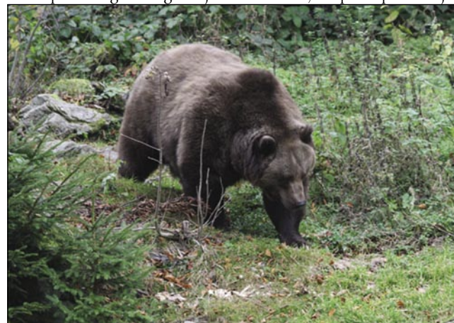
Našo paut sprejaja rjavi medved

Starci Kočevarov ali kočevski Nemcov so prišli v tau krajino v 14. stoletji. Njini gospaudge so je pripelali oprvin s Koroške, sledik pa iz drügi talov gnešnje-