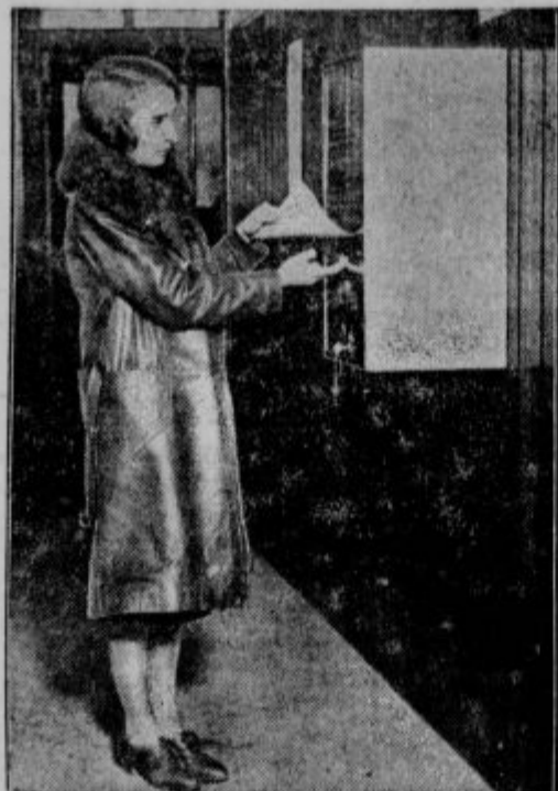
Gromofonske plošče v avtomatu. V veži nekega londonskega kina stoji avtomat, ki postreže proti določenemu novcu z gramofonskimi ploščami najnovejših »slagerjev«. Plošče so nezlomljive, upogljive, neogorljive in sedemkrat lažje nego običajne gramofonske plošče.

Priznati je treba, da petletni načrt stoji in pade s Stalinom. Malokdo je, ki bi verjel v njegovo izvršitev, a Stalin gotovo veruje. Hoče ga izvesti. Diktator je sodobne Rusije in brez pretiranja lahko rečemo, da je malo ljudi tako obsovaženih kakor on. Nad vso državo se čuti njegova železna roka. Če bi ta roka popustila, potem bi se zgodilo kakor s trdo vpreženim konjem, ki začuti svobodo. Z njegovim koncem bi se sesulo tudi delo, nad katerega uresničenjem bi danes mogli mnogi boljševiki sami resno dvomiti.