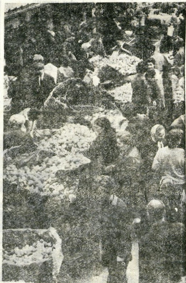
V teh dneh, ko se je treba oskrbeti z ozimnico, je kranjska tržnica vedno premajhna, vedno je gneča. Oskrba z ozimnico povzroča vsako leto precej skrbi. Prav bi bilo, da bi oživili — morda v okviru Gorenjskega sejma — posebne sejme ozimnice, posebno v letinah, kakršna je letos, ko so pridelki dobro obrodili.