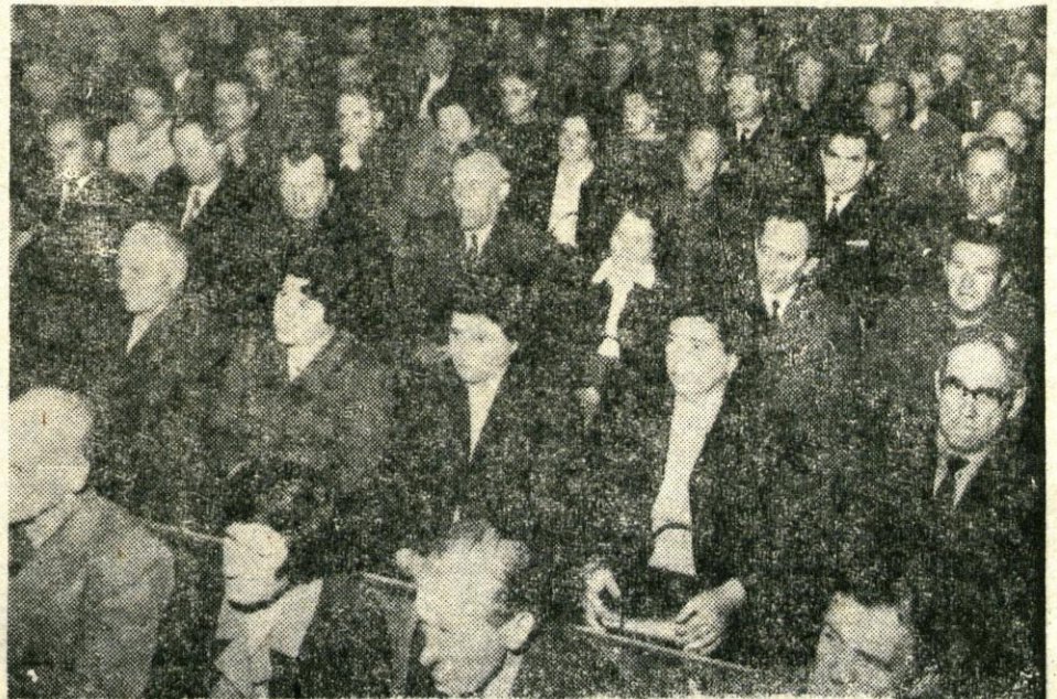
Proslave v počastitev 30. obletnice tekstilne stavke se je v Tekstilindusu udeležilo tudi večje število udeležencev stavke

Trenutno je za festival prijavljenih že 47 filmov iz 12 držav. Za najboljše filme bodo organizatorji podelili beli, srebrni in bronasti Triglav. Posebne nagrade so pripravljene tudi za režijo, scenarij, kamero in glasbo. V prihodnje bo ta festival v Kranju vsako leto. A. Z.