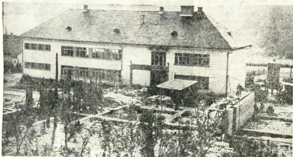
ŠOLA V ŽELEZNIKIH — 15. julija so v Železnikih pričeli z adaptacijo in dozidavo šole. Delovne organizacije v Selški dolini bodo za gradnjo šole plačevale 1 odstotek od čistega osebnega dohodka na zaposlenega. Računajo, da bodo tako zgradili šolo v dveh etapah. Letos bodo zbrali okoli 52 milijonov starih dinarjev, celotno delo pa bo stalo okoli 150 milijonov starih dinarjev. Predvidevajo, da bo adaptacija in dozidava zaključena do 15. avgusta 1967.