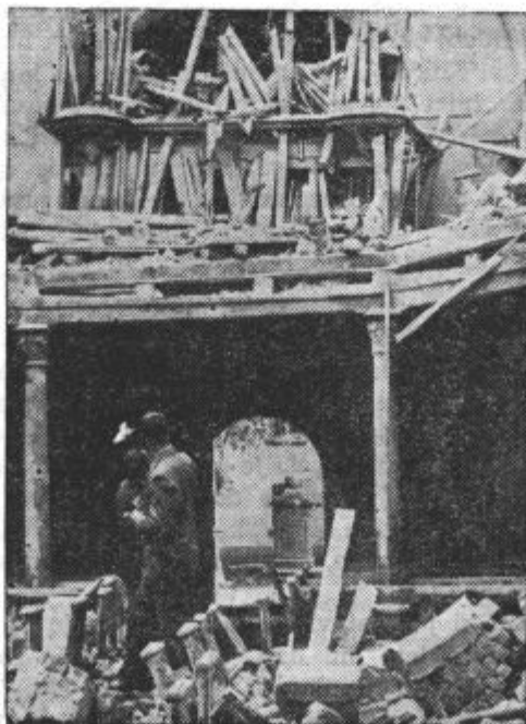
Bombe so dobro zadele svoj cilj

Najuspešnejša in najgrozovitejša vrsta bombarderjev so težki bombniki, tako zvane »leteče trdnjave«, ki so enokrillni štirimotorni avioni z