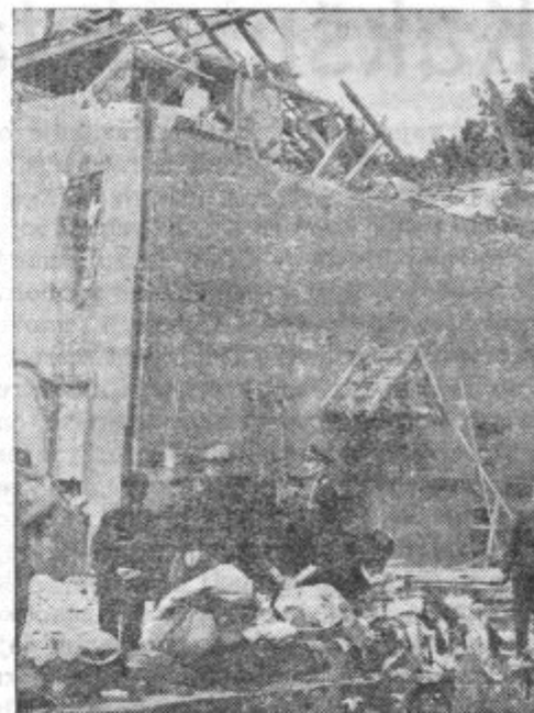
Strašno razdejanje po letalskih bombah

Ban, ki je postavljen na razpoložanje in je bil najmanj leto dni ban, prejema plačo tudi na razpoložanju, vendar pa največ eno leto. To leto se mu računa tudi za dosego pravice do pokojnine.