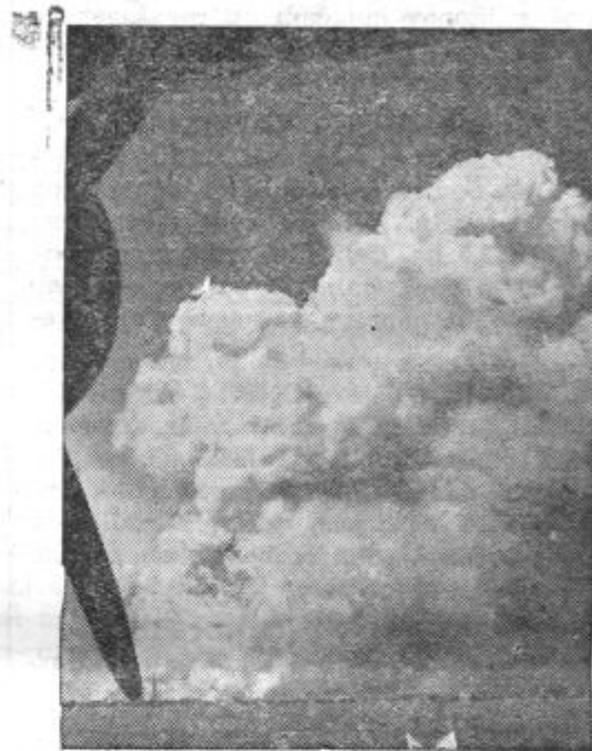
Nad gorečim mestom

S tega vidika gledano je bil in je nenapadalni pakt med Nemčijo in Rusijo naravna nujnost. Ako je Nemčija uspešno hotela pričeti