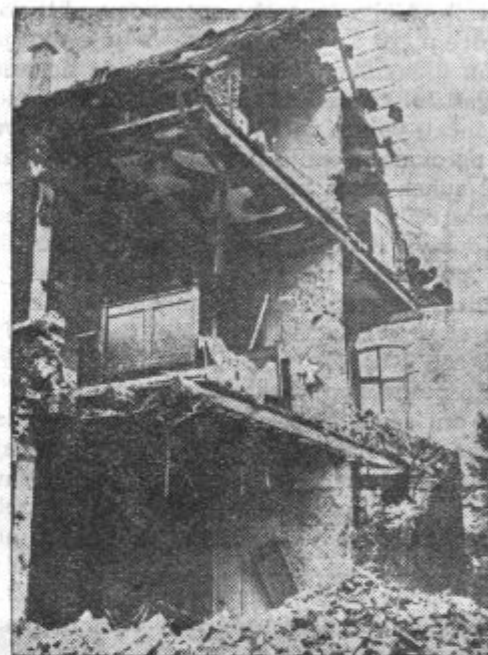
Žetev bombnikov je vedno obilna

Japonsko zanima v prvi vrsti petrolej Holandske vzhodne Indije. Kakor pri vseh drugih narodih, tako se je tudi na Japonskem zelo dvignila motorizacija. Moderna vojna je brez tankov,