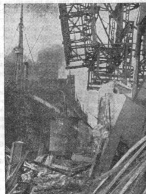
Tako izgleda kraj, kjer divja vojna

■ Zob za zob. Član angleškega vojnega kabineta Greenwood je izjavil, da bo angleško letalstvo vrnilo Nemcem vsak udarec, ki ga povzroče Angliji. Ono, kar je bilo storjeno Londonu, bo dvakrat povrnjeno Berlinu. Greenwood je dalje dejal, da je škoda, ki so jo angleška letala povzročila v zapadni Nemčiji in Porurju mnogo večja nego škoda, ki so jo letalski napadi doslej prizadeli Angliji.