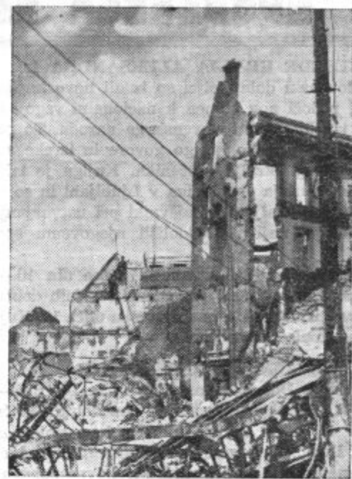
Del francoskega mesta Amiens

brzino 380 do 420 km in akcijskim radijem 2000 do 8000 km. Posadka, ki je od 5 do 7 mož, ima do 11.000 km ter močjo povzpenjanja v višino do težkih strojnic. »Leteče trdnjave« uporabljajo na razpolago 2000 do 4000 kg bomb in 4 do 7 letalska poveljstva za bombardiranje in rušenje velikih centrov. V veljavo je ta vrsta letal prišla posebno v sovjetsko-finskem spopadu, kajti Rusi so z njimi Mannerheimovo linijo ob pomoči sovjetskega težkega topništva popolnoma razrušili. Težke in strašne bombe, ki jih spuščajo ti bombniki, v teh dnevih kar na vso moč razbijajo in uničujejo angleška in nemška mesta, v spominu pa nam še vedno tiči, kako so Rusi s takšnimi svojimi letali finske Helsinke skoraj popolnoma izenačili z zemeljskim nivojem. Prav tako Nemci Varšavo.