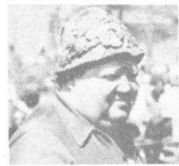
»Nič nimamo proti, če kanec vsega tega veselja ostane tudi za ostale dni.« je sredi najživahnjšega tabornega vrveža porekel nek Polhograjec. »Vse te naravne lepote tod okoli so na voljo vsakomur.«

»Blagajana«, čeprav brez večjih izkušenj, je tako vsekakor uspešno prestala svoj test. A tako kot to, prizadevno in vsestransko društvo, bržčas tudi sama turistična ponudba v kraju, ki se vedno pluje v širokem toku neizkoriščenih možnosti.