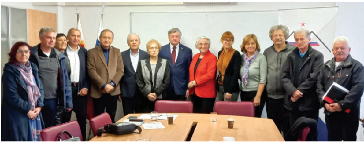
Vodstvo slovenske borčevske organizacije za obdobje 2023–2027