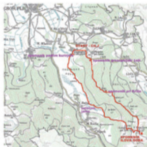
Trasa pohoda na Ilovo Goro.

Planinsko društvo Grosuplje na ta dan vabi na tradicionalni pohod na Ilovo Goro. Start pohoda bo ob 7.30 uri izpred gostilne LUNCA v Zagradcu pri Grosupljem.