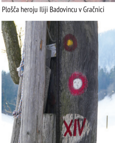
Markacija Poti XIV. divizije