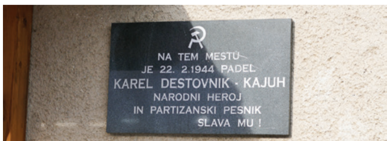
Plošča na kraju Kajuhove smrti, Žlebnikova domačija, Šentvid pri Zavodnju 2