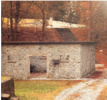
Spomenik na Oklem

kolski dom) v središču Domžal, ob 20. uri je bil požgan grad Krumperek, s posekanimi drevesi so za nekaj ur blokirali promet na cesti južno od Doba. Okoli 22. ure ta dan so zažgali gospodarsko poslopje gradu Križ. Te akcije so poleg drugih razlogov, zlasti zelo močnega razmaha vseh