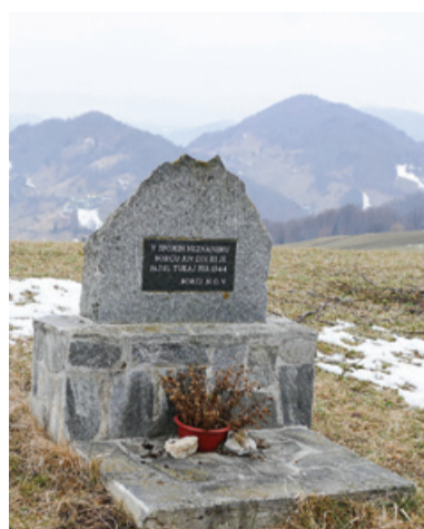
Grob neznanega partizana v Oleščah