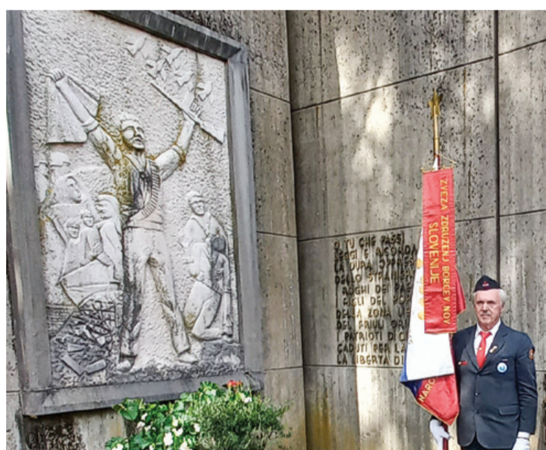
Spominska prireditev v Fojdi v Furlaniji

Med 26. in 30. septembrom je potekala velika nemška vojaška operacija z namenom zavzeti svo-