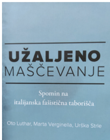
Naslovnica nove knjige

Spomini na fašistični teror na Primorskem so še zelo živi. V nasprotju z nacističnimi taborišči je bilo njihovo široko razvejeno omrežje v režimu fašistične Italije lep čas po drugi svetovni vojni precej prezrto in manj raziskano. Snovalci knjige Užaljeno maščevanje so v nekaj letih opravili pogovore z več deset preživeli in tako rekoč ujeli zadnji vlak za pričevanja iz prve roke, saj je interniranje počasi vse manj ... Čeprav z leti spomin blede, so preživeli povedali marsikaj, kar je bilo doslej javnosti manj znanega ali celo neznanega – eni več, drugi manj, nihče od njih ne zaradi maščevalnosti, ampak zaradi resnice. Knjiga je izjemno sporočilno bogata in negira vse novodobne revizionistične poskuse in potvorjene zgodovinske trditve, da Italija s fašizmom ni imela nič. Pričevanja preživeli v italijanskih fašističnih taboriščih in številne doslej objavljene znanstvene razprave in študije to odločno zanikajo. Italijani so bili eden od okupatorjev Slovenije leta 1941 in so na svojem okupiranem območju izvajali vse oblike fašističnega nasilja: aretacije, deportacije, internacije, streljanje talcev, in česar ne smemo nikoli pozabiti – storili so tudi vojne zločine.