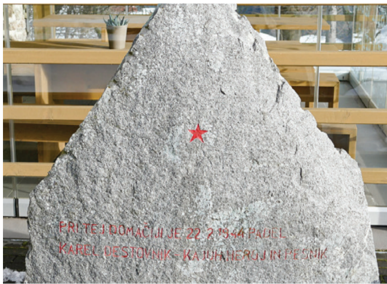
Spomenik Kajuhu v Šentvidu pri Zavodnju

Vendar ni. Oblastniki in starejši so nas prinesli okoli. Mladim so vzeli veter iz jader, usmerjali so ga k še mlajšim in celo otrokom. Res je, da imajo otroci čisto srce, ampak njim je imeti pomembnejše od biti . In počasi so se korak za korakom leto za letom redčile vrste ljudi, ki so bili pripravljeni trpeti za boljši svet. Celu umetniki so se sprijaznili s projekti, ki nam delajo ta svet znosnejši, a ga ne spreminjajo. Stari svet je ostal. Sicer je boljši, kot je bil v tvojih časih, a še vedno je le stari svet.