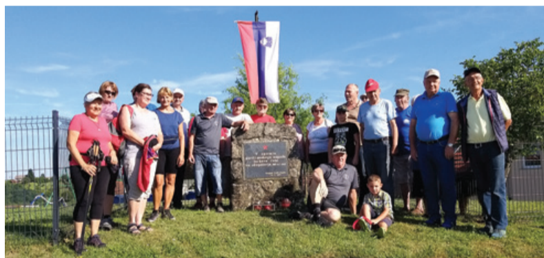
Pohodniki pri obeležju na kraju prvega spopada partizanov z okupatorjem na območju upravne enote Lenart v Stanetincih

Med vsakoletnimi delovnimi stalnicami Združenja borcev za vrednote NOB Cerkevjak so bile tudi doslej v tem letu urejanje in vzdrževanje spomenikov in obeležij NOB, več spominskih pohodov, tudi na Vanetino s prižigom svečk zavezniškimi ameriškim letalcem, spominska šolska ura ob dnevu upora, streljanje z zračno puško za učence Osnovne šole Cerkevjak - Vitomarci in predstavitev vojaškega poklica, okrogla miza in predavanje za učence višjih razredov osnovne šole o Cerkevjaku v času upora 1941-1945. Okrogla miza je letos obravnavala dve temi: zgodovino slovenskega naroda in prvi terenski odbor Osobodilne fronte na območju upravne enote Lenart.