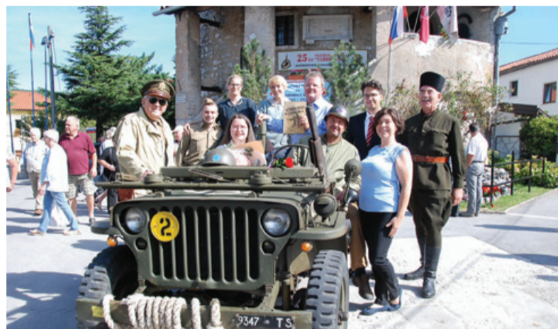
Nastopajoči člani družine Rože ob vojaškem džipu