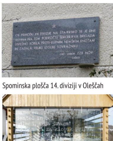
Spominska plošča 14. diviziji v Oleščah