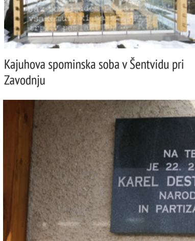
Kajuhova spominska soba v Šentvidu pri Zavodnju