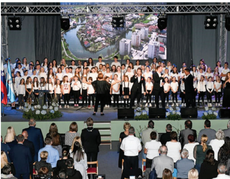
Prireditev si je ogledalo veliko domačinov in gostov.