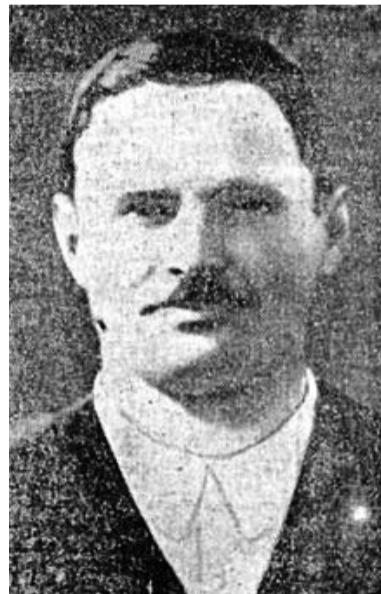
Jože Lacko, slovenski partizan in narodni heroj

6. avgusta pa svet ne sme pozabiti na prvo atomsko bombo, ki je bila odvržena leta 1945 na Hirošimo. Hirošima in Nagasaki pomenita največji pomor civilnega prebivalstva, ki še danes ni obsojen kot vojni zločin. Prva je v drugi svetovni vojni opozorila na nepotrebno pobijanje civilnega prebivalstva z bombardiranjem mest norveška vlada v Londonu, ki je dokazala, da je manj civilnih žrtev pri ciljnih