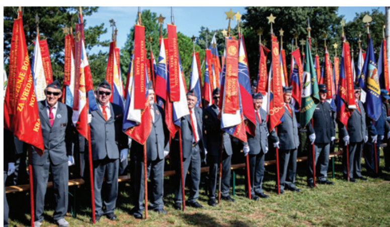
Praporščaki na prireditvi v Opatjem selu

Letos je pripravo in izvedbo prevzelo Združenje borcev za vrednote NOB Nova Gorica. Zakaj odločitev za Opatje selo? Ker je to prireditveni prostor, ki ima tradicijo različnih množičnih srečanj, in ker je Kras gotovo pokrajina, ki je