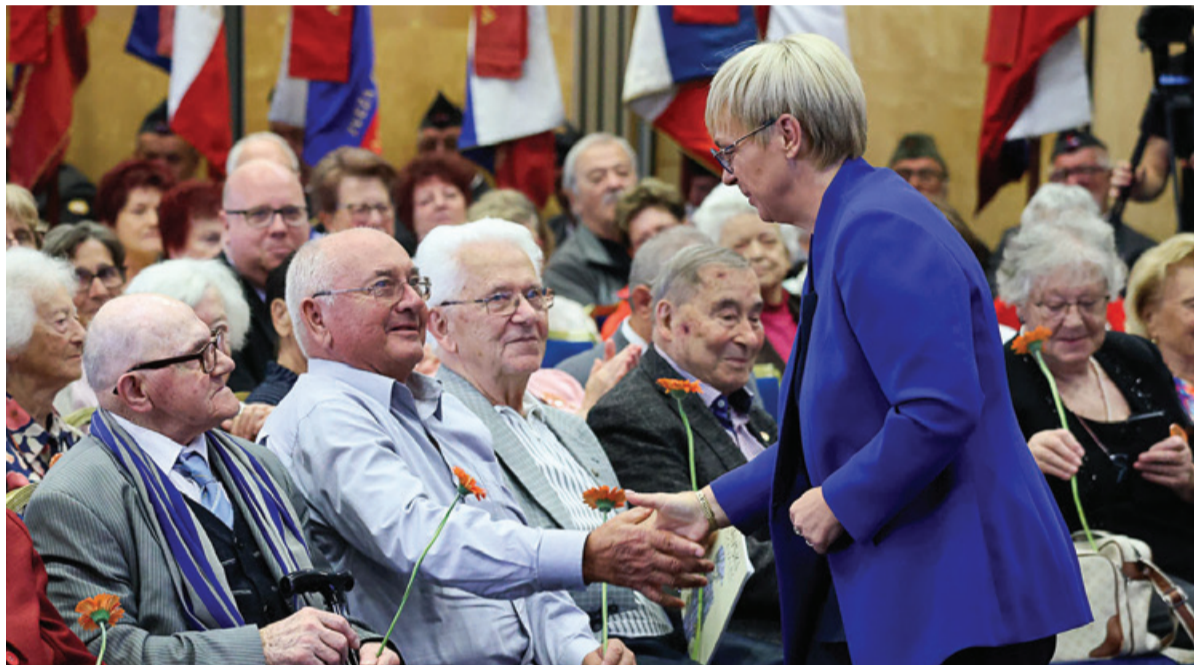
Predsednica Republike Slovenije je pozdravila še redke preživle taboriščnice in taboriščnike.

Slovesnosti v Portorožu so se med drugim udeležili tudi zunanja