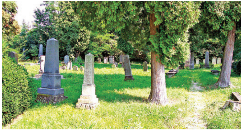
Judovsko pokopališče v Dolgi vasi pri Lendavi – tudi kraj spominjanja na holokavst

Najusodnejše za večino slovenskih Judov, zlasti še Judov iz Prekmurja, je bilo leto 1944. Ne smemo pozabiti, da je Nemčija po prevzemu oblasti na Madžarskem marca 1944 od aprila do oktobra tega leta aretirala in deportirala v koncentracijska oziroma uničevalna taborišča vse prekmurske Jude. Tragedija je bila toliko večja zato, ker so bili v okviru projekta množičnega uničevanja madžarskih Judov prvi na udaru prav Judje iz pokrajine ob Muri, največ iz Lendave in Murske Sobotice. Za name-