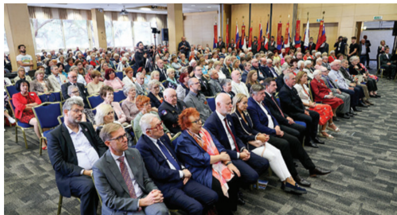
Prireditev je bila dobro obiskana. Potomci in njihovi prijatelji ohranjajo spomin na dogodke iz NOB

neprecenljivosti medsebojnih vezi, svobode in lastne domovine. Preživle taboriščnice in druge žrtve vojnega nasilja in njihove svojce ter potomce je pohvalila, da so nam vsem zgled in opomin: »Kazete nam, kako pomembni so strpnost, razumevanje in dialog. Da moramo znati odpuščati in na napakah graditi nove vezi med nami. Sobivanje narodov ter spoštovanje mednarodnega prava, človekovih pravic in svoboščin morajo biti trajni temelji naše skupne prihodnosti. Brez tega naš svet preprosto ne more