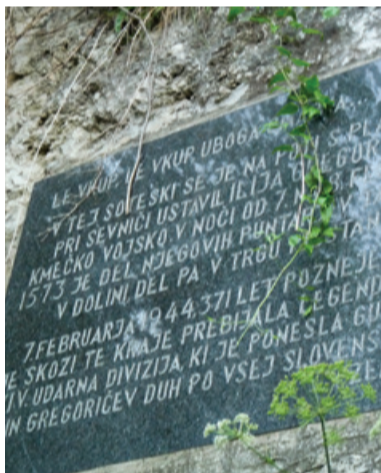
Spominska plošča kmečkim uporom in 14. diviziji pri Pilštanju

Stane Gradišnik