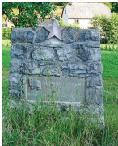
Spomenik 14. diviziji v Stari Žagi