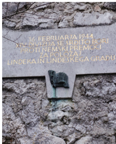
Spominska plošča 14. diviziji na gradu Lindek