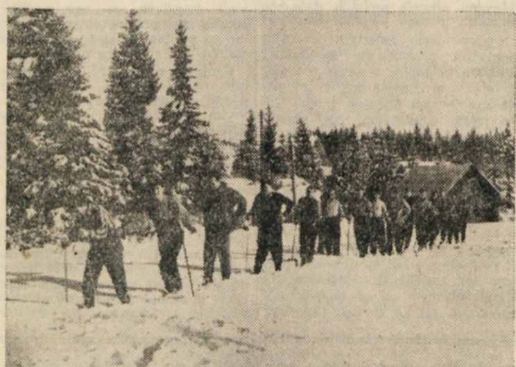
KARAVANA TRŽASKIH SMUČARJEV.

Planinskemu društvu pa moramo izreči vse priznanje za brezhibno organizacijo prijetnega zimovanja, upravi in osebju Doma pa prav tako zahvalo za vso pozornost in postrežbo.