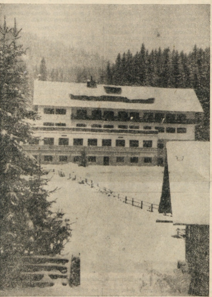
NOVI DOM NA POKLJUKI.

skih poročil ni mogla odločiti za odhod.