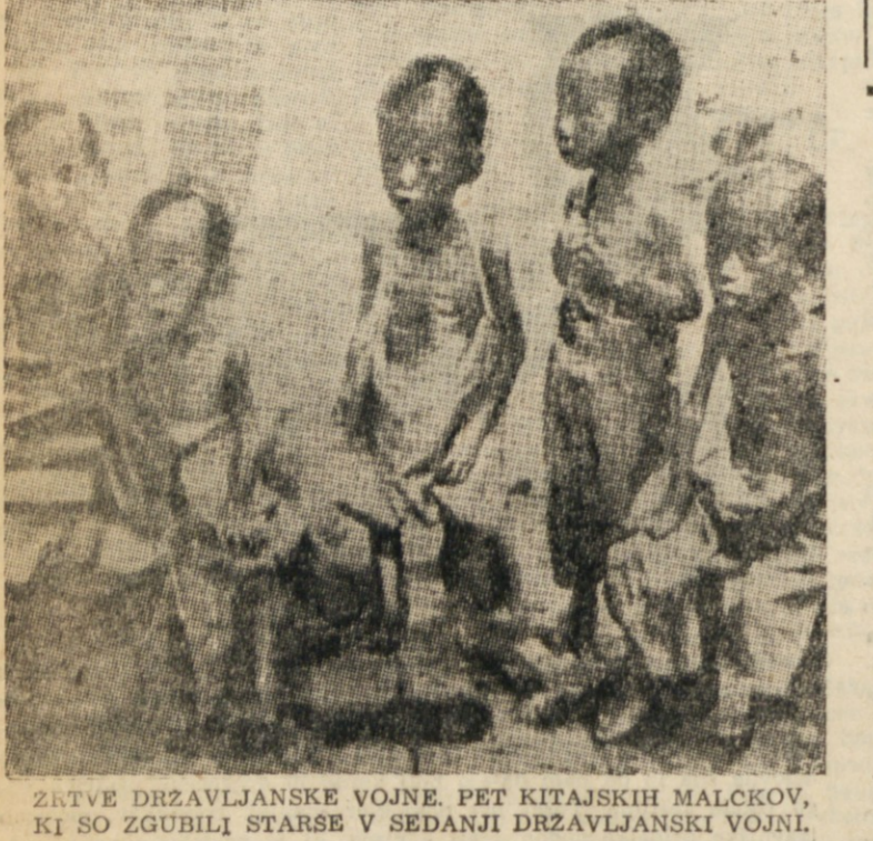
ZRTVE DRŽAVLJANSKE VOJNE. PET KITAJSKIH MALČKOV, KI SO ZGUBILI STARŠE V SEDANJI DRŽAVLJANSKI VOJNI.