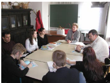
Tečaj slovenščine za odrasle