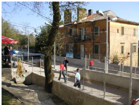
Jog zopet v funkciji po 20-tih letih