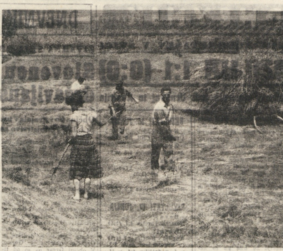
PLAVJE. Trava je letos dobera. Zaradi obilne rege je lepa, visoka, gosta in sočna. Kmetje jo zadovoljno so zadovoljni, saj bi ne smelo primanjkovati krme za živali.