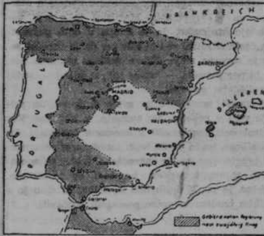
Slika od čet generala Franca zaseocene Španije kmalu po Leridnu vstaje nacionalistov (na levi) in po dveh letih državljanske vojne (na desni).