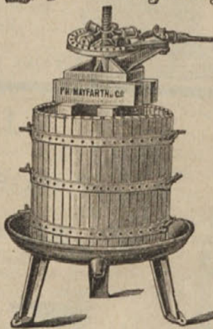
Stiskalnica za grozdje.

Najboljše stiskalnice za grozdje in olive