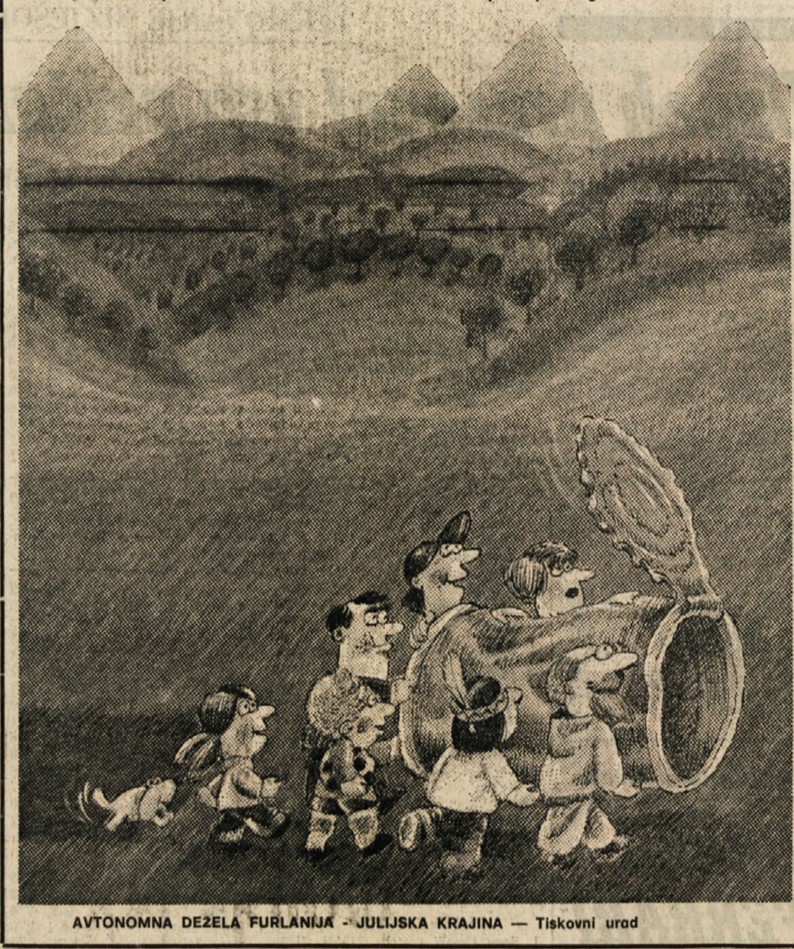
AVTONOMNA DEŽELA FURLANNA - JULIJSKA KRAJINA — Tiskovni urad

Začnimo torej z novo pobudo že na velikonočni ponedeljek, 7. aprila. Imenovali jo bomo Štiripersna detelja 80 — proti onesnaževanju. Pobuda se tudi ne sme zaključiti s 7. aprilom, ampak mora nadaljevati skozi vse leto. Odpravi se torej na izlet v naravo in vzemi s sabo vrečo, kamor boš najprej spravil svoje odpadke: nato zvrtni nekaj svojega časa, da odstraniš še tiste odpadke, ki so jih pustili drugi izletniki, odnesi vrečo domov in jo naslednji dan izroči smetarjem. Tedi boš lahko res rekel, da je tvoja dežela zelena in čista tudi po tvoji zaslugi.