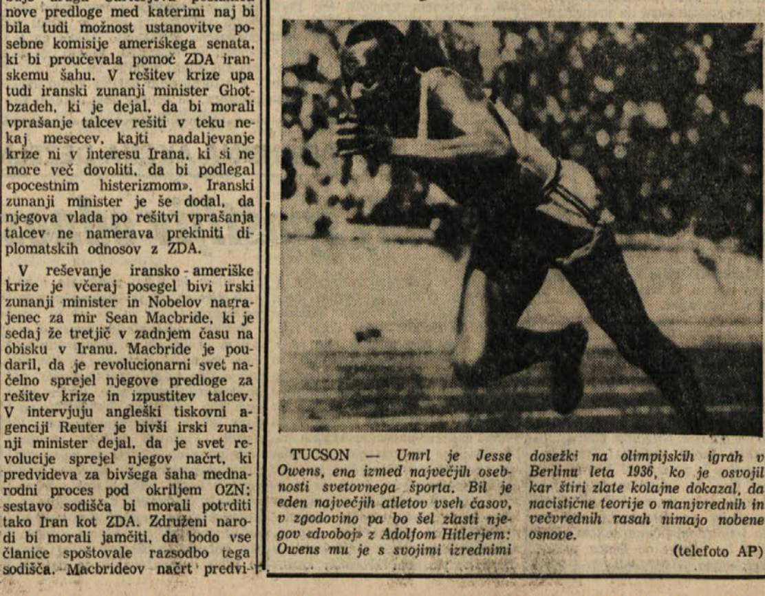
TUCSON — Umrl je Jesse Owens, ena izmed največjih osebnosti svetovnega športa. Bil je eden največjih atletov vseh časov...