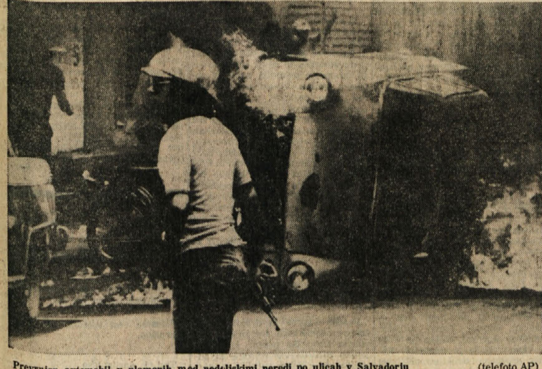
Prevržen avtomobil v plamenih med nedeljskimi neredi po ulicah v Salvadorju