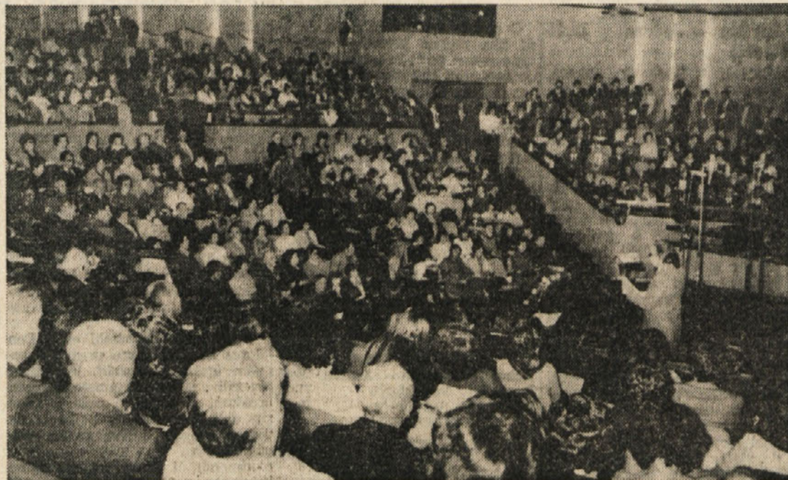
Pogled na polno dvorano avditorija v Gorici med sobotnim koncertom

Aa goriskem odru se je zvrstilo enajst zborov - Pevce in poslušalce je pozdravil podpredsednik SPZ Milko Rener