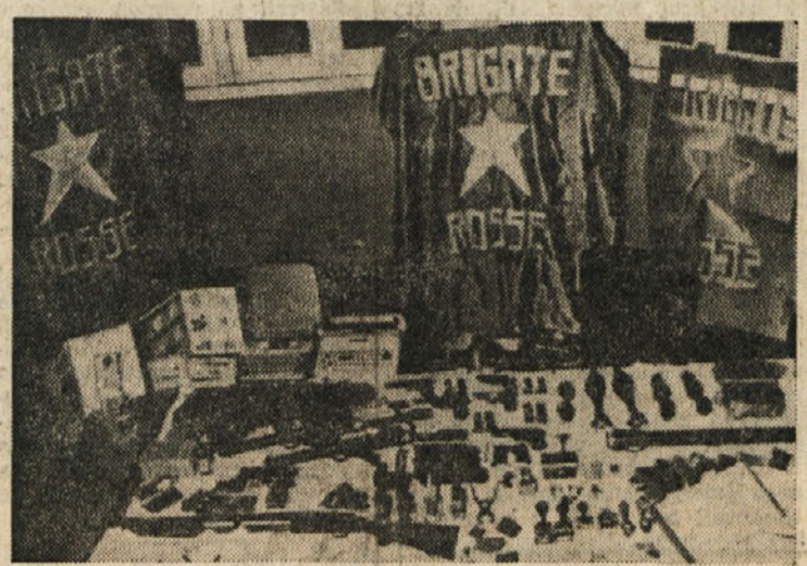
Prapori rdečih brigad in orožje, zaplenjeno v stanovanju v Ul. Fracchia v Genovi

Kdo je četrti ubiti terorist v Ulici Fracchia v Genovi?