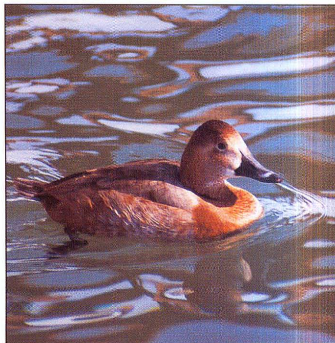
Slika 2: Samice so veliko redkejšje (M. Vogrin)

Fig. 1: During the spring passage, males are prevalent (M. Vogrin)