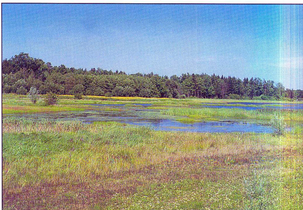
Fig. 5: Rački ribniki - Požeg Landscape Park

Slika 5: Krajinski park Rački ribniki - Požeg