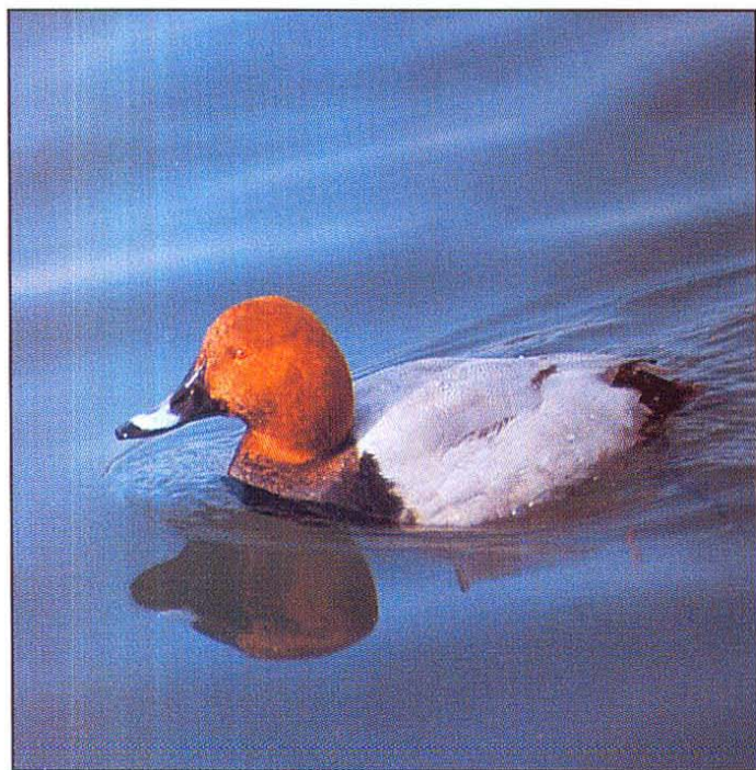
Slika 1: Na spomladanskem preletu močno prevladujejo samci (M. Vogrin)

Krajinški park Rački ribniki - Požeg leži na Dravskem polju v severovzhodni Sloveniji. Zavarovan je od leta 1992 (Medobčinski uradni vestnik 1992). Obsega okrog 484 ha (FLAJŠMAN 1996). Osrčje parka oblikuje, skupaj z mešanim nižinskim gozdom, loko in travniki, deset vodnih površin: Rački ribniki (trije), Turnovi ribniki (trije), ribniki v Grajevniku (trije) ter akumulacija Požeg. Te vodne površine merijo skupaj okrog 76 ha. Podrobnejši