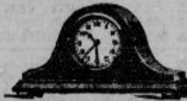
Budilke iz lesa od Din 84 - naprej, brez budilke Din 48 -

Zahtevajte cenik zastonj in pošt. prosto!