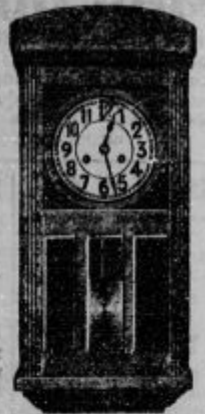
Stenske ure z bitjem, idoča štirinajst dni od

Zahtevajte cenik zastonj in pošt. prosto!